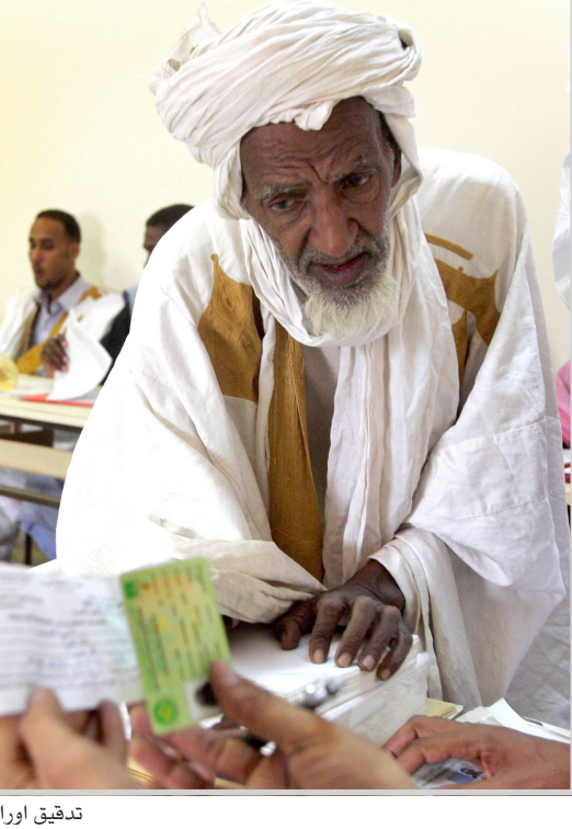
تدقيق اوراق الناخبين

نواكشوف / وكالات أظهرت نتائج فرز الأصوات في الانتخابات الموريتانية التي جرت أمس الأول الأحد بأن المرشحين للرئاسة سيدي ولد شيخ عبد الله (الغالبية الرئاسية سابقا) واحمد ولد داداه سيتواجهان في الدورة الثانية للانتخابات