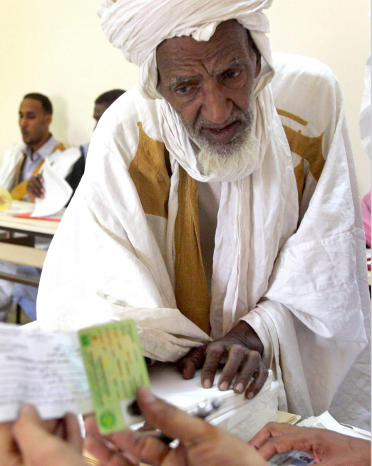
تدقيق اوراق الناخبين

أظهرت نتائج فرز الأصوات في الانتخابات الموريتانية التي جرت أمس الأول الأحد بأن المرشحين للرئاسة سيدي ولد شيخ عبد الله (الغالبية الرئاسية سابقا) واحمد ولد داداه سيتواجهان في الدورة الثانية للانتخابات