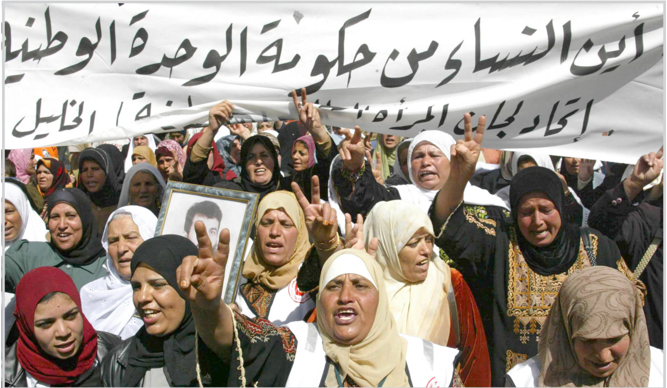
تظاهرة نسوية في فلسطين