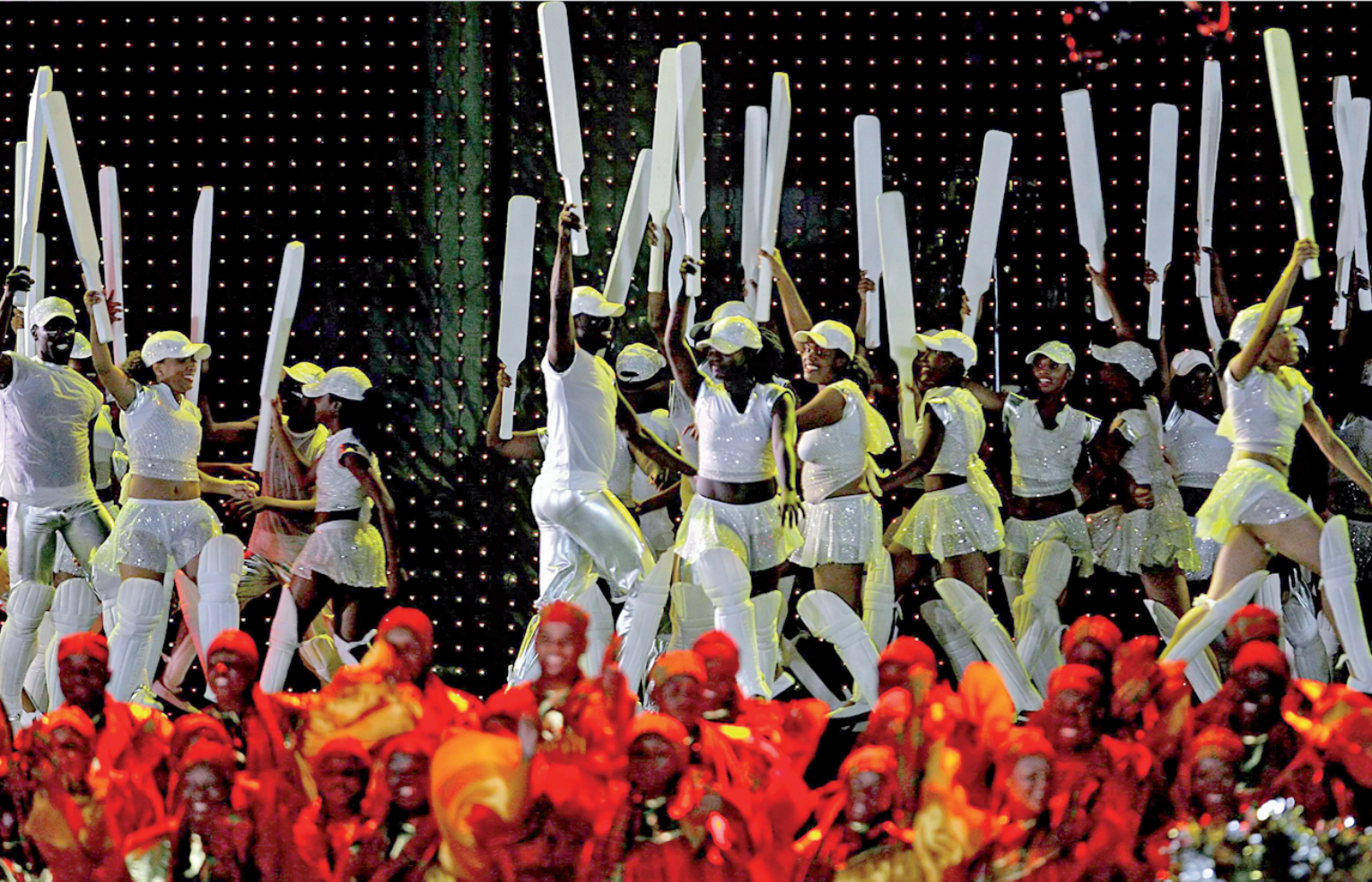
جامايكا: عروض رقص خلال افتتاح مهرجان ( ICC ) كأس العالم للعبة الكريكت في مدينة تريلاوتي وهو اكبر حدث دولي في هذه اللعبة والذي سيبدأ في الثالث عشر من اذار في غرب الانديز.