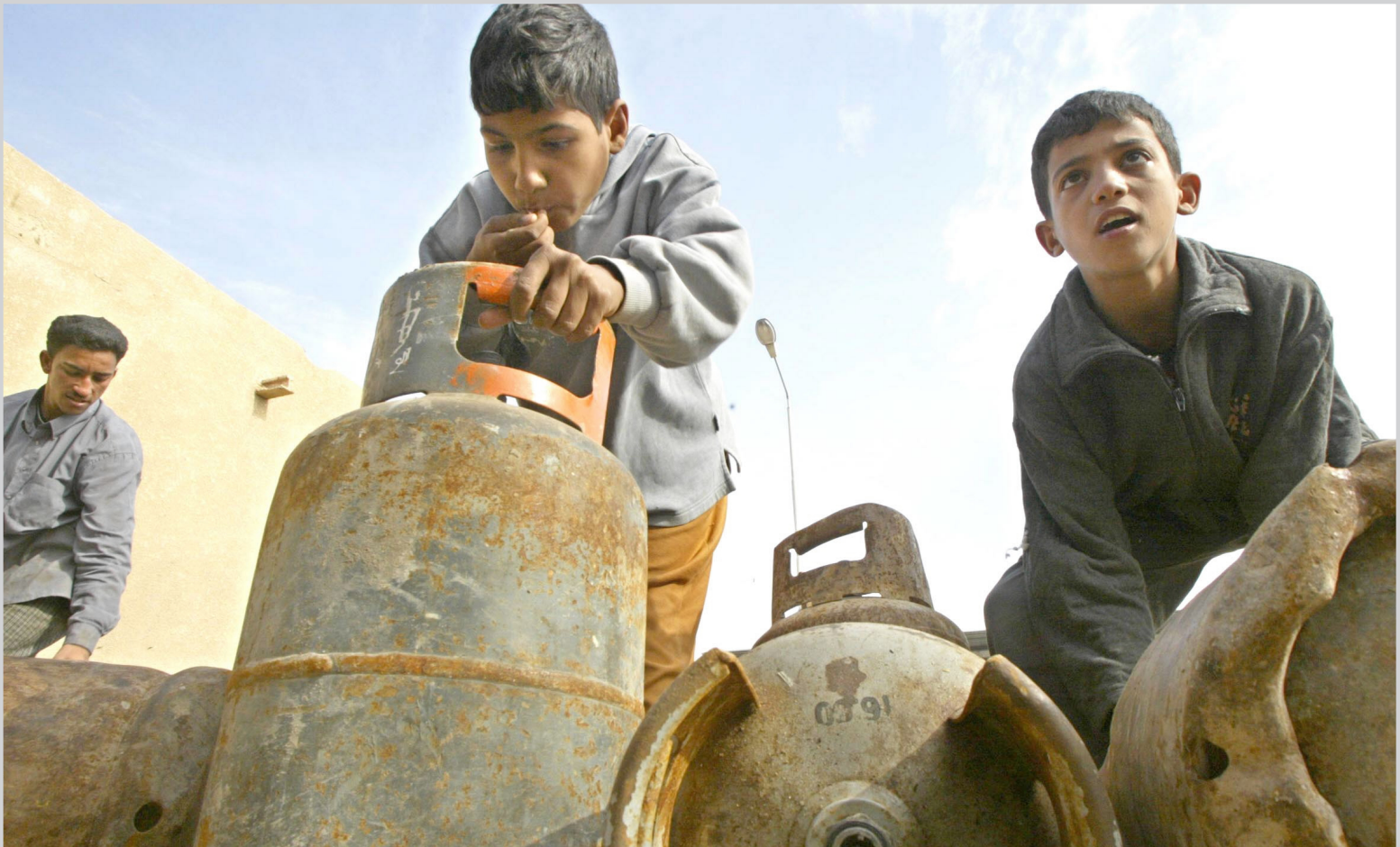
خصخصة العمال الانتاجية الخدمية تؤثر مباشرة على المواطن

٣- اعداد برنامج للتدريب التحويلي يركز على التخصصات التي سترقق الطلب عليها في المستقبل القريب و تقديم التسهيلات الائتمانية لمساعدة