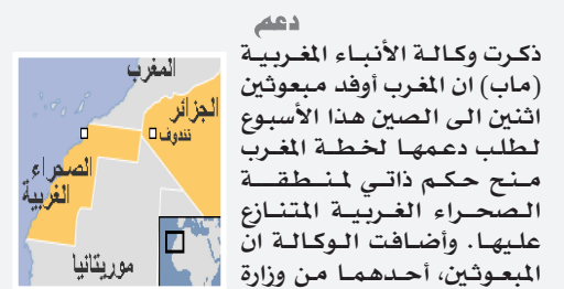
خريطة الصحراء الغربية

انتخب الحزب الاشتراكي الديمقراطي في السويد في مؤتمر استثنائي، مونا سالين رئيسة له، لتصبح بذلك اول امرأة تشغل هذا المنصب في تاريخ الحزب. وانتخب سالين (٥٠ سنة) بالأجماع في اجراء شكلي، كونها المرشحة الوحيدة التي اختارتها اللجنة الانتخابية للحزب في ١٨ كانون الثاني. وصوت مندوبو الحزب الملهون للانتخاب وعددهم ٣٥٠ في مؤتمر استثنائي للحزب عقد يومي السبت وأمس الأحد في ستوكهولم بدعم كبيرة لمرشحهم الوحيد.