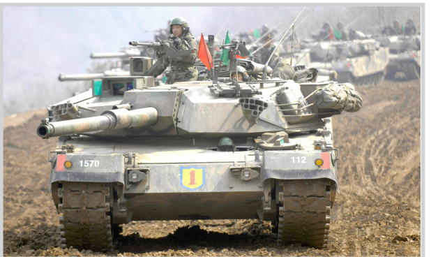
قوات كورية شمالية

الشمالي في الملف النووي الموجود في كين قوله ان بلاده بدأت الاستعدادات لاغلاق مجمع يونجبيون النووي القائم في شمال العاصمة الكورية الشمالية بيونغ يانغ.