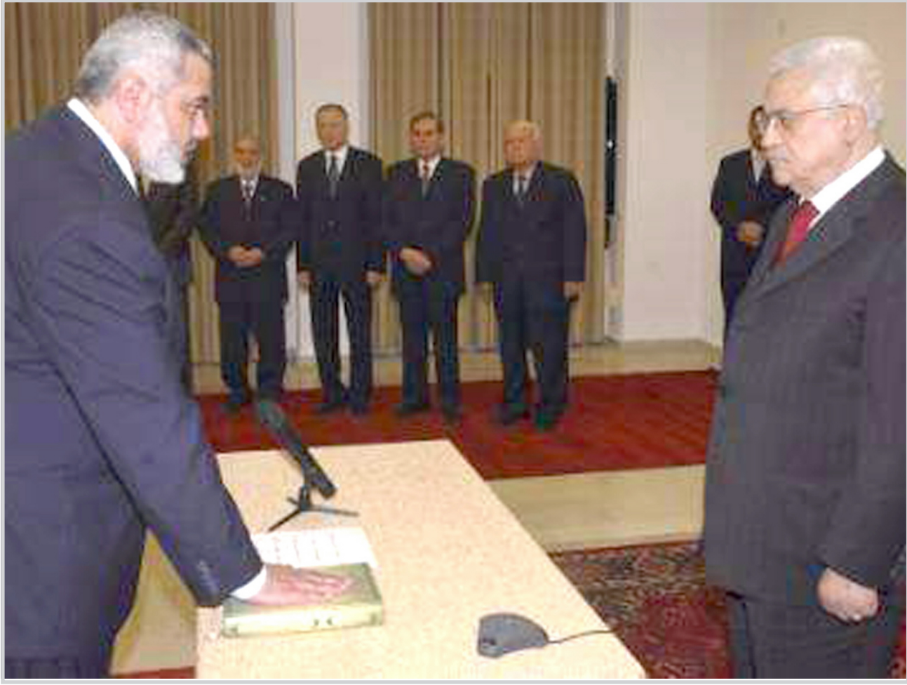
اسماعيل هنية يؤدي اليمين الدستورية امام الرئيس الفلسطيني محمود عباس

الإسرائيلية العمل مع الحكومة الفلسطينية الجديدة، بقولها: "لن نعترف ولن نتعامل مع حكومة ترفض الاعتراف بوجودنا، وتدعم الإرهاب، ولا تعترف بالاتفاقيات السابقة". وأضافت المتحدث الإسرائيلية قولها: "بكل أسف، لم تقبل الحكومة الجديدة بمبادئ اللجنة الرباعية للحوار، بل إن رئيس الوزراء الفلسطيني اسماعيل هنية، تطرق في حديثه عن تسهكه بحق المقاومة، وهو ما يعني بوضوح عدوته لمزيد من الإرهاب والتعسف الفلسطيني ضد الإسرائيليين".