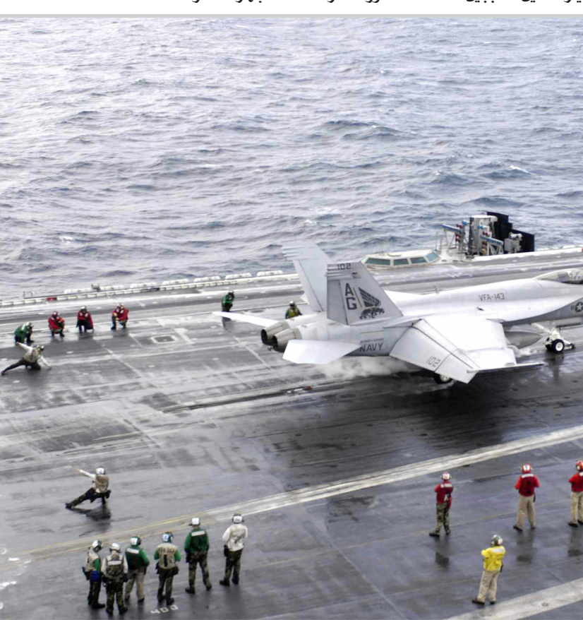
حاملة طائرات أمريكية

أو في أغراض سلمية. وكانت بريتوريا اقترحت تعديلات تجرد مشروع القرار من بنوده الأساسية وهي حظر على صادرات إيران من كل الأسلحة وقيود مالية على مسؤولين إيرانيين ومؤسسات إيرانية. وفي نفس السياق أعلن الرئيس الإيراني محمود حمدي نجاد انه سيقدم "اقتراحات جديدة" لمجلس الأمن الدولي حول الملف النووي، واصفا مواقف الولايات المتحدة وبريطانيا بأنها "غير شرعية"، وذلك في مقابلة بثت أمس الأول.