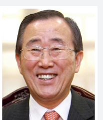
بان كي مون

وصل الامين العام للامم المتحدة بان كي مون الى القاهرة المحطة الثانية من جولته في الشرق الأوسط لاجراء محادثات تتمحور حول تحريك عملية السلام في المنطقة. وذكر وكالة انباء الشرق الاوسط المصرية ان بان وصل مساء أمس الأول الخميس الى العاصمة المصرية قادما من بغداد. وسيجري محادثات مع الرئيس المصري حسني مبارك والامين العام للجامعة العربية عمرو موسى.