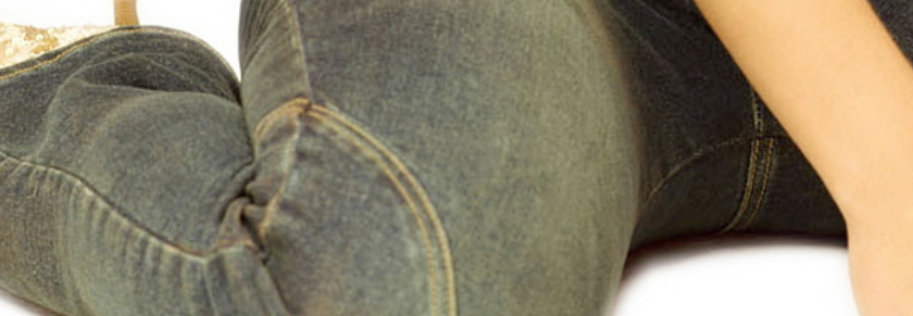
المغنية بريتي سبيرز

وكانت سبيرز بعد بإصدار ألبوم هذا العام، قبل تضجر مشاكلها الشخصية على صفحات وسائل الإعلام الصغراء.