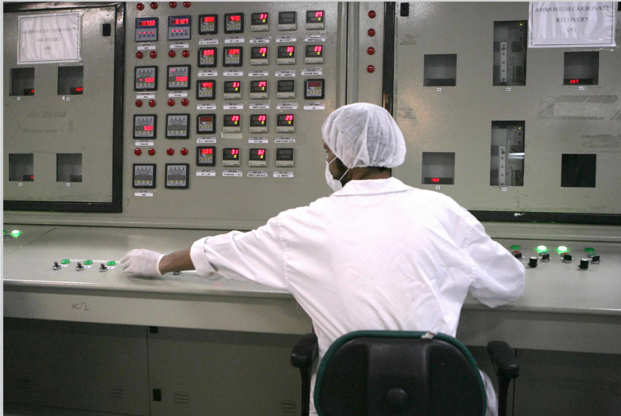
لوحات سيطرة خاصة بمفاعل نووي إيراني

وتقول الان مقدمة القرار ان حل المشكلة النووية الإيرانية سيساهم في الجهود العالمية لحظر الانتشار النووي و"يحقق اهداف إخلاء الشرق الأوسط من اسلحة الدمار الشامل بما في ذلك وسائل اطلاقها". ويحتاج تمرير مشروع القرار لتأييد تسعة أصوات على الأقل شريطة الا تستخدم اي من البلدان الخمس دائمة العضوية