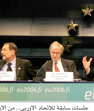
جلسات سابقة للاتحاد الأوربي.. من الأرشيف

وبشأن نجاح الاتحاد الأوروبي في سياسته نهوت فيريرو الى انه "في علاقاتنا مع شركائنا الدوليين نسلط الضوء على القيم التي نعقد أنها ساهمت في نجاحنا. فاهدهارنا قد نما من شكل خاص من التعاون الإقليمي الذي تطور يدا بيد مع التزام أعمق بالديموقراطية، و حقوق الإنسان، و سيادة القانون. فهذه التجربة التي هي سرنجاحنا، هي التي نسعى لعرضها للأخرين". وعن إسهامات الاتحاد الأوروبي في العالم قالت: "يوجد للاتحاد الأوروبي حول العالم شبكة كثيفة من الاتفاقيات الرسمية و ما يزيد عن ١٣٠ بعثة بما في ذلك بعثة في العراق، للتعاون مع الدول حول مواضيع مثل التجارة، والطاقة و البيئة، وحقوق الإنسان، والجرائم المنظمة دوليا. ويوجد لدينا أدوات متوفرة للسياسة الخارجية، وليس فقط سياساتنا التجارية و سياسات الاعانات ولكن يوجد أيضا استجابتنا السريعة للطوارئ الإنسانية، و كذلك بعثاتنا العسكرية وبعثات الشرطة التابعة لنا. ومع تقوية