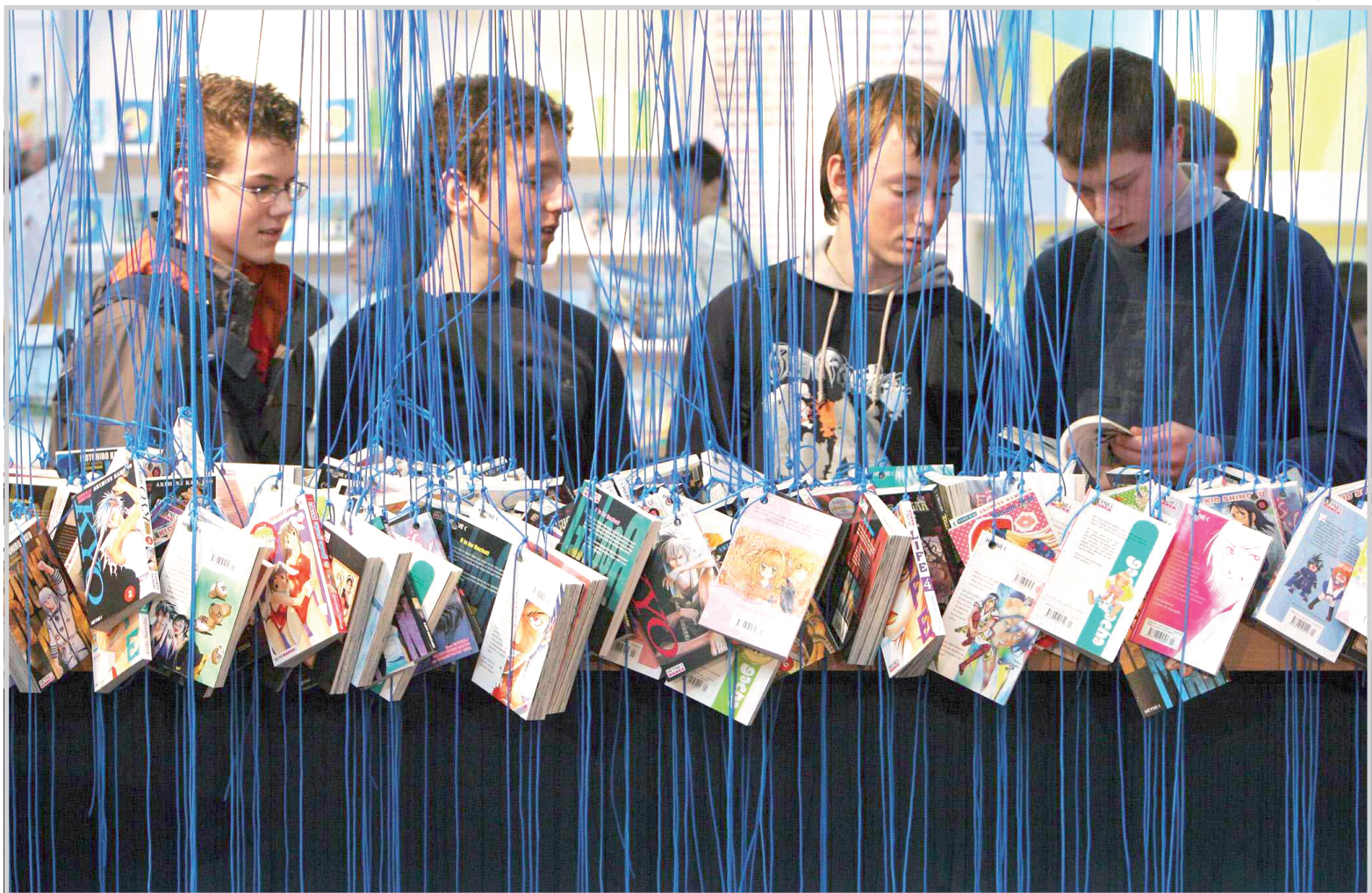
مراهقون يقرأون كتباً داخل معرض لا يبزج للكتاب الذي أقيم مؤخراً في شرق المانيا. ويشارك اكثر من ٢٢٠٠ عارض كتب من ٣٦ بلداً خلال لقاء الربيع لصناعة الاعلام والكتاب.

كما يستعد النجم للمشاركة في بطولة الفيلم السينمائي الجديد "روبين هود"، حيث يجسد دور شريف نوتنجهام ، ومن المقرر أن يتقاضى كرو الحائز جائزة الأوسكار قرابة ٢٠ مليون دولار مقابل قيامه بدور البطولة .