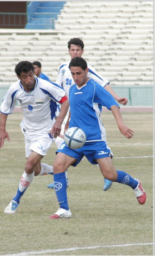
نقطة من مباراة الطلبة في المرحلة الثانية من الدوري.. تصوير صباح العاني

بينما اصبح موقف النفط حرجا وصعبا . من جهة اخرى فاز فريق الشرطة على القوة الجوية بنتيجة (٢-١) في المباراة التي جرت بينهما على ملعب الصفاة الدولي بعد ان ظهرت علامات التعب على لاعبي الطلبة. واستطاع النقط ان ينقل كرات خطيرة ومن كرة ملعوية بشكل صحيح استطاع لاعب النفط رعد حمودي من اللاعبين مهاجمي