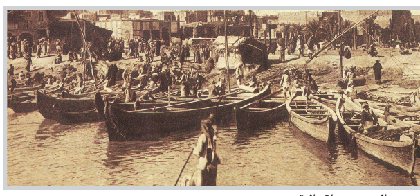
مسور من العراق القديم