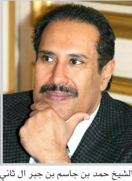
الشيخ حمد بن جاسم بن جبر ال ثاني

إلى ذلك اتهمت الحكومة التشادية ميليشيات الجنجويد السودانية حليفة نظام الخرطوم بهجومه قريتين شرق تشاد السبت وقتل ٢٩ مدنيا. وقال وزير الاتصالات التشادي هورمدجي موسى دومغور في بيان ان "الحكومة تؤكد الهجوم على قريتي تيبير ومورينا في وادي سيرا من قبل ميليشيات الجنجويد المسلحة السودانية، وقد قام المهاجمون باحراق القريتين بالكامل وقتلوا ٢٩ شخصا". و اضاف البيان ان قوات الامن التشادية صدت المهاجمين ما ادى الى مقتل ٢٥ عنصرا من الجنجويد خلال المواجهات.