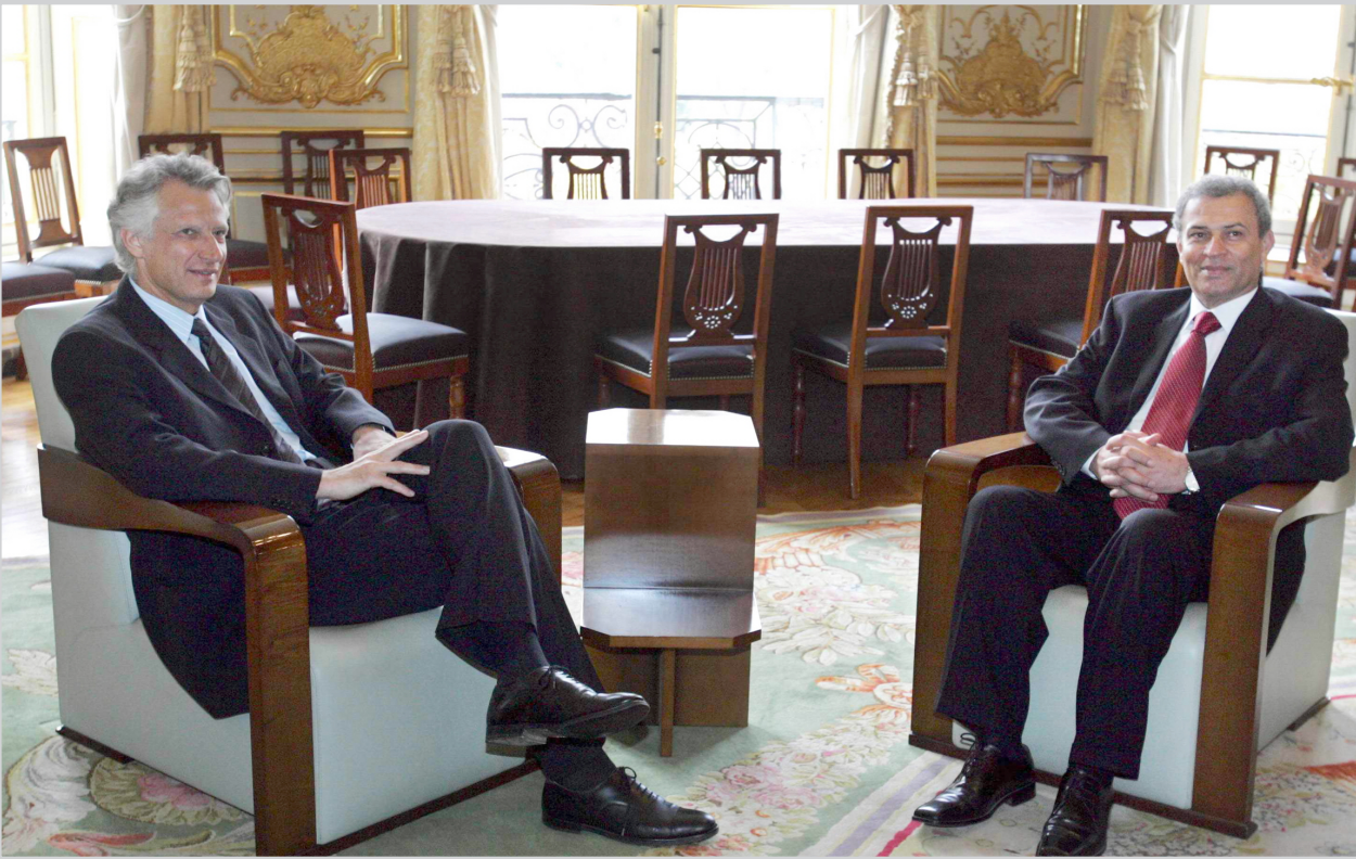
وزير الخارجية الفلسطيني زياد أبو عمرو مع نظيره الفرنسي فيليب دوست بلازي

المتحدة والاتحاد الأوروبي بما وصفه باستثمار مبادرة السلام العربية التي أعادت قمة الرياض تبنيها دون تعديل. واعتبر داليمبا في لقاء جمعه بنظيره الغربي محمد بن عيسى في الرباط ان المبادرة هي "الأهم حاليا على الأرض". من جهة أخرى دعا سيمون بيريز نائب رئيس الوزراء الاسرائيلي الرياض إلى "تنسيق" الجهود لإرساء السلام في الشرق الاوسط. وقال بيريز في تصريحات للإذاعة الإسرائيلية ان "الدول العربية تقول انها تريد السلام، وعلى الرغم من أنها تفرض شروطا صعبة فإنها استبدلت إستراتيجية القضاء على اسرائيل بسياسة سلام". و اضاف بيريز "حتى وان غير العرب معزوفتهم، فمازلنا للأسف بحاجة الى قائد اوركسترا لعزفها، ويمكن للسعودية ان تلعب مثل هذا الدور". على صعيد آخر أجرى وزيران فلسطينيان مباحثات الاثنين في عاصمتين أوروبيتين في تطور جديد باتجاه فك الحصار الدولي عن الفلسطينيين. حيث التقى وزير الخارجية