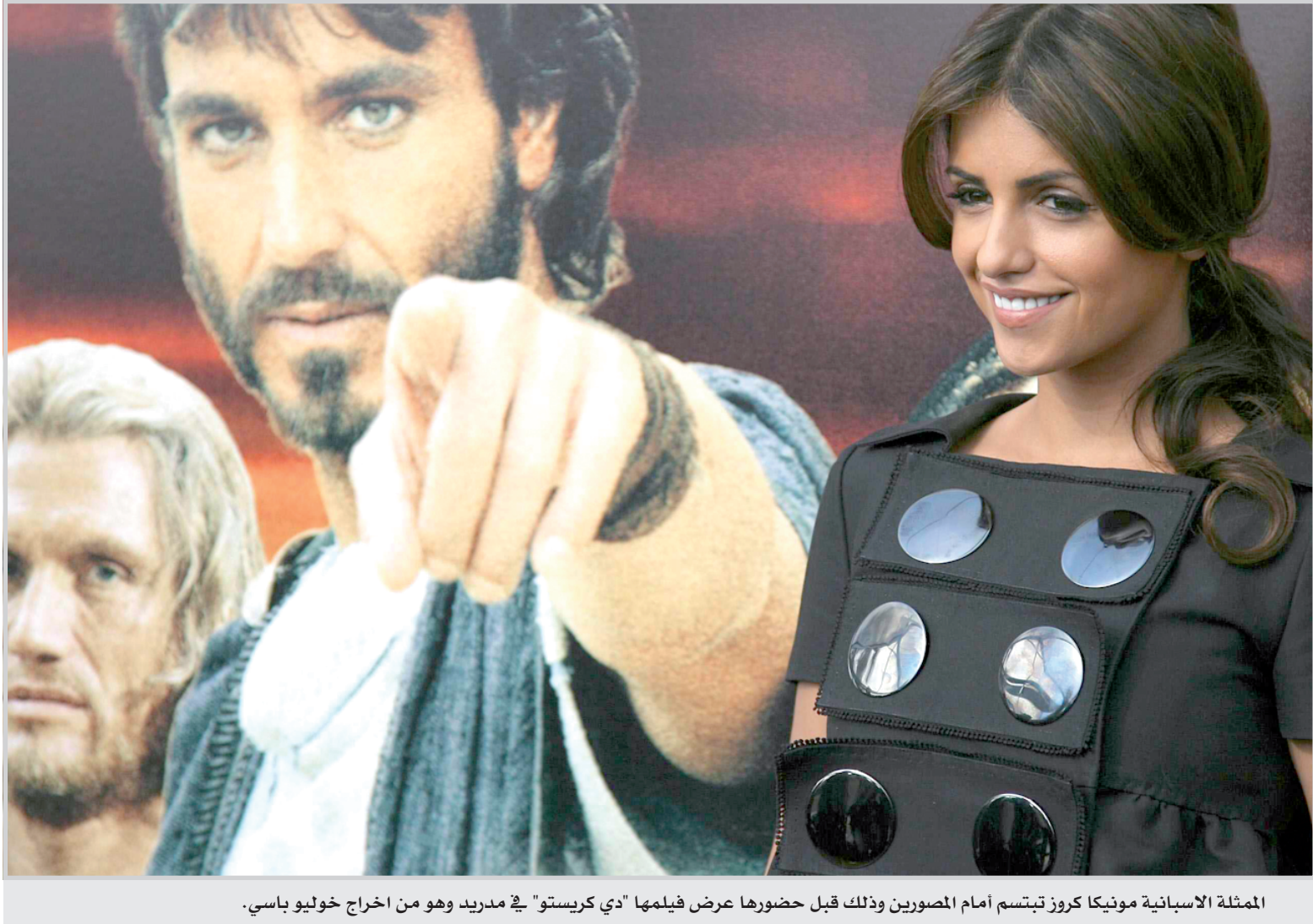
الممثلة الاسبانية مونيك كروز تبسم أمام المصورين وذلك قبل حضورها عرض فيلمها "دي كريستو" في مدريد وهو من اخراج خوليو باسي.

حطم القطار الفرنسي السريع، الثلاثاء، الرقم القياسي العالمي في السرعة على السلك الحديد عندما بلغت ٥٧٤,٨ كلم في الساعة وقالت أسوشيتد برس إن الرئيس الفرنسي المنتهية ولايته جاك شيراك حيا الإنجاز معتبرا إياه "أداء رائعا يعد دليلا على امتياز صناعة سكك الحديد الفرنسية". وأضاف أن "تي جي في الستوم"(الشركة المصنعة للقطار) تثبت أنها البطلة في السوق العالمية للسرعة القصوى. ومن جهته، اعتبر وزير النقل الفرنسي دومينيك بيريون أن بلاده أكدت "مركز الزعامة على مستوى العالم". وأوضح مدير الشركة للقطار باتريك ترانوي أن الهدف كان بلوغ سرعة ٥٧٠ في الساعة وأن سرعة ٥٨٠ في الساعة كانت تعني المجهول بالنسبة إليها. ونقلت عدة قنوات تلفزيونية أوروبية الحدث عندما كان القطار الذي يحمل اسم "في ١٥٠" وهو يقطع ما نسبته ١٥٠ مترا في الثانية، فيما كان الصمت يخيم داخله قبل أن يقطعه التصفيق والتصفير عندما بلغ تجاوز الرقم السابق ٥١٥,٣ كلم في الساعة. ويبقى الرقم القياسي لجميع أنواع القطارات السابق للقطار الياباني ماغليبي الذي يعمل على سكة مغناطيسية وليست حديدا ووصلت سرعته إلى ٥٨١ كلم في الساعة عام ٢٠٠٣.