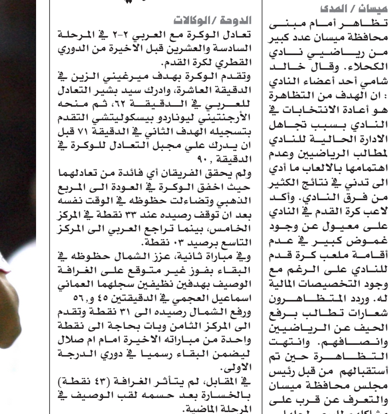
تريزيغيه خارج تشكيلته دومينيك