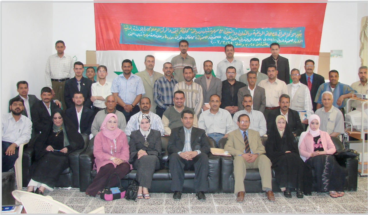
صحفيي رياضيين الفترات الاوسط في لحظة تذكارية