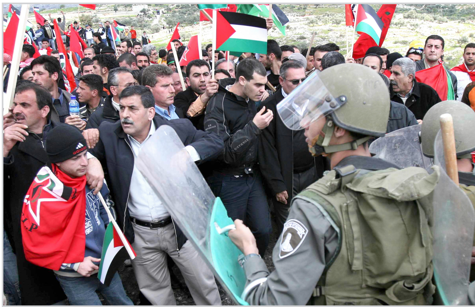
جنود اسراييليون يفرقون تظاهرة لمواطنين فلسطينيين