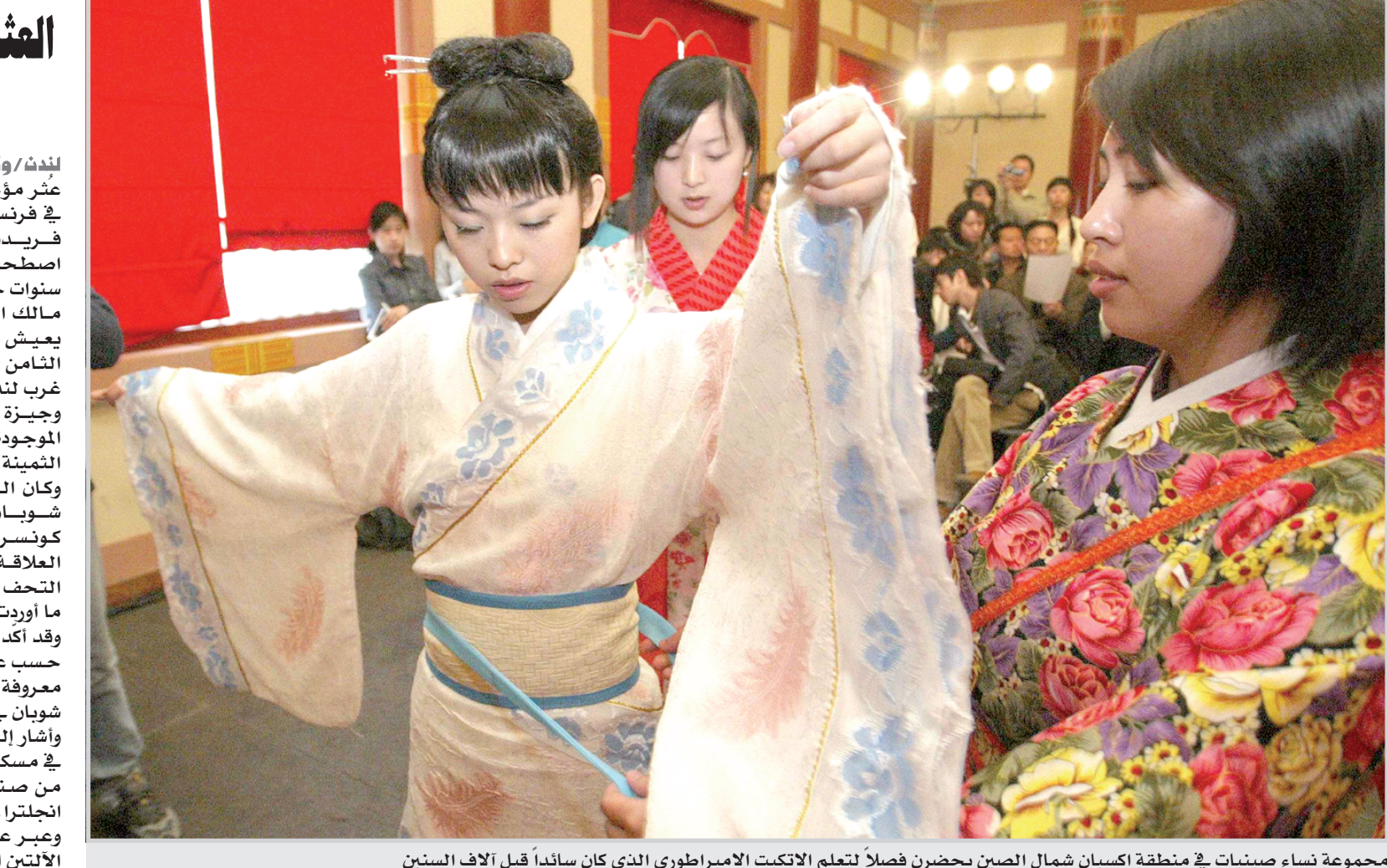
مجموعة نساء صينيات في منطقة اكسيان شمال الصين يحضرن فصلاً لتعلم الاتكيت الامبراطوري الذي كان سائداً قبل آلاف السنين

لندن/وكالات عثر مؤخراً في إنجلترا، على بيانو مصنوع في فرنسا. كان الموسيقار البولوني الأصل، فريدريك شوبان (١٨٤٩-١٨١٠) قد اصطحبه معه خلال إقامته في لندن، إبان سنوات حياته الأخيرة. مالك البيانو الحالي، أليك كوبي، الذي يعيش في قصر ريفي من قصور القرن الثامن عشر، بمنطقة هاتشاندن، جنوب غرب لندن، صرح بأنه لم يعلم، إلا قبل فترة وجيزة فقط، بأهمية الآلة الموسيقية الموجودة في قصره، وسط مجموعة التحف الثمينة التي يقتنيها. وكان الباحث الموسيقي المختص بأعمال شوبان، جان جاك إغليدينغر، من كونسرفاتوار جنيف، هو الذي اكتشف العلاقة بين الآلة المقتناة في مجموعة التحف الإنجليزية والموسيقار الكبير، وفق ما أوردت الأسوشيتد برس. وقد أكد مقتني البيانو، كوبي، من جهته، أنه حسب علمه لم يبق سوى ثلاث آلات بيانو معروفة في العالم من تلك التي استخدمها شوبان في تأليف موسيقاه وعزفها. وأشار إلى أن الموسيقى الشهير كان يحتفظ في مسكنه اللندني بثلاث آلات بيانو، اثنتان من صنع فرنسي، وواحدة مصنوعة في إنجلترا. وعبر عن سعادته العارمة لوجود إحدى الآلتين الفرنسيتين في لديه.