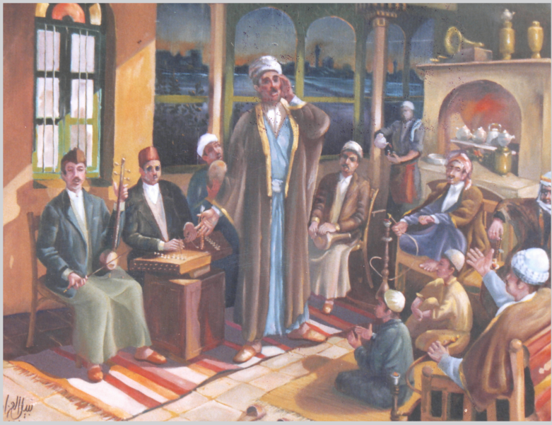
المقام العراقي في بغداد القديمة