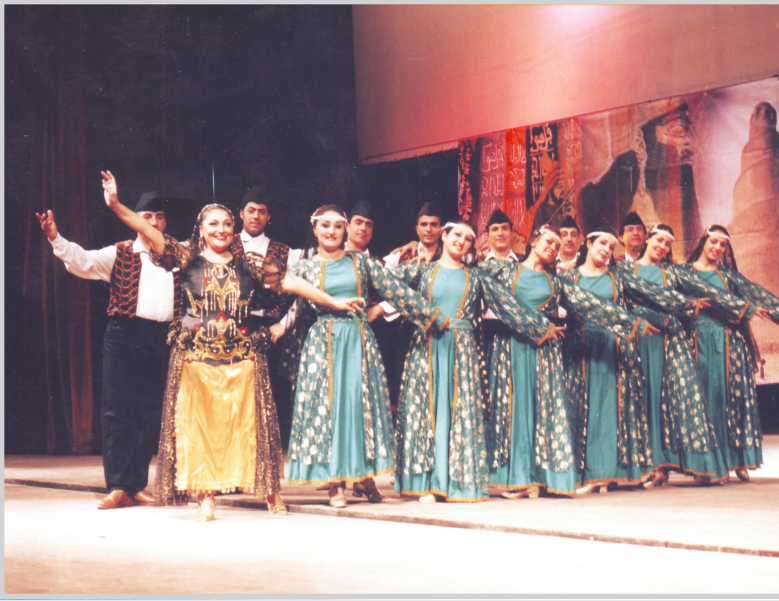
فرقة الفنون الشعبية