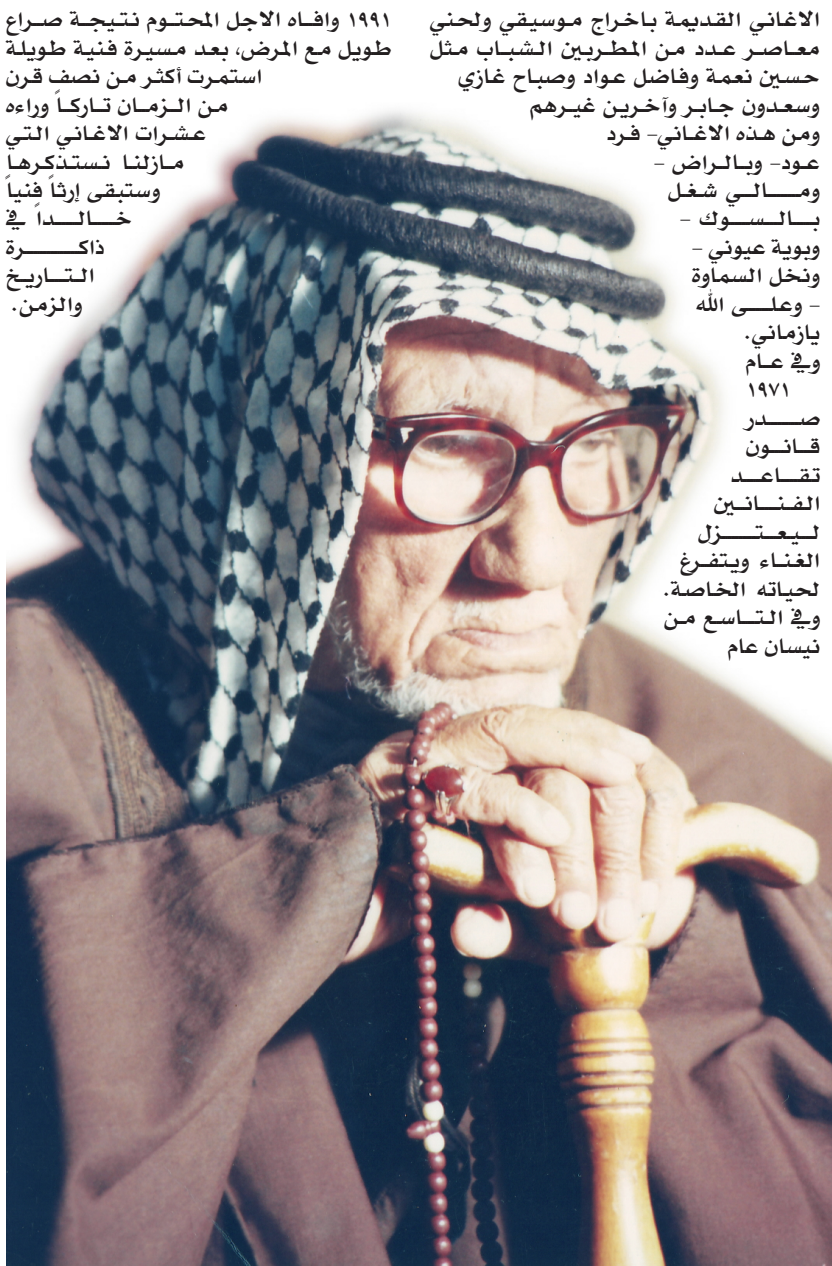
الفنان ناصر حكيم

الغاني القديمة باخراج موسيقي ولحني معاصر عدد من المطربين الشباب مثل حسين نعمة وفاضل عواد وصباح غازي وسعدون جابر وآخرين غيرهم ومن هذه الأغاني- فرد عود- وبالراض - ومالي شغل - بالسوك - وبوية عيوني - ونخل السماوة - وعلى الله - يازماني. وفي عام 1948 شارك الفنان الراحل ناصر حكيم مع مجموعة من المطربين العراقيين من بينهم ناظم الغزالي وعلي مردان وحضيري ابو عزيز باحياء حفلات غنائية ترفيحية لمقاتلي الجيش العراقي الباسل الذي كان يقاتل دفاعا عن الأرض العربية في فلسطين. كما سافر في الخمسينيات الى عدد من الدول العربية والخليجية لتسجيل عدد من الحفلات الغنائية هناك. إضافة الى مشاركته في تلك الفترة في تقديم أغانيه من خلال تلفزيون بغداد، عبر البرنامج الأسبوعي "ركن الريف" الذي كان يخرجها الفنان الراحل كمال عاكف. ومن الجدير بالذكر هنا ان نشير الى ان اغلب اغنيات الراحل ناصر حكيم غناها بصاوتهم في محاولة رائعة لتجديد هذه