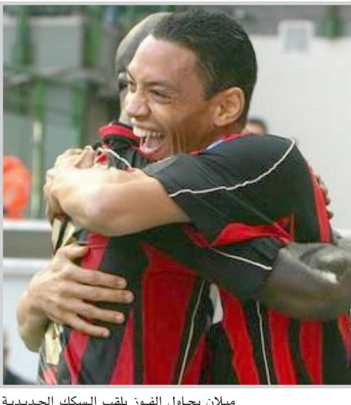
ميلان يحاول الفوز بلقب السكك الحديدية

المواصم / وكالات أكدت صحيفة "سبورت إكسبريس" الروسية أن فريق ميلان الإيطالي الفائز بلقب دوري أبطال أوروبا لكرة القدم حديثا سيشارك في فعاليات الدورة الودية التي ينظمها فريق لوكوموتيف موسكو بمشاركة فريق ريال مدريد الإسباني في الفترة من الثالث إلى الخامس من أغسطس المقبل. ومن المتوقع أن يكون نظام الدورة التي تحمل لقب "كأس السكك الحديدية" مكونا من مبارتي قبل نهائي في افتتاح البطولة تتبعهما في اليوم الثاني مباراة لتحديد المركزين الثالث والرابع ثم مباراة النهائي. ويعتبر فريق لوكوموتيف موسكو الممثل الرسمي لعاملي قطاع السكك الحديدية بروسيا الذين يحتفلون بعيدهم السنوي في أول يوم أحد من شهر أغسطس من كل عام وهو ما يتزامن مع الدورة المقبلة.