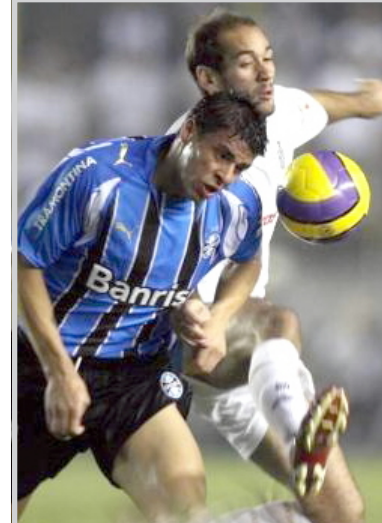
فلومينينزي يحرز دوري السامبا لأول مرة

المواصم / وكالات وقع حارس مرمى المنتخب الإيطالي لكرة القدم جيانلويجي بوفون عقدا جديدا مع فريقه يوفنتوس بنتهي عام ٢٠١٢ واضعا حدا لكل التكهات التي تناولت رحيله إلى فريق آخر. وقال بوفون عقب توقيعه العقد الخسيس "هو يوم مهم بالنسبة لي. لقد كتبت صفحة جديدة في مسيرتي الرياضية وحياتي. القرار مرتبط بحبي لهذا الفريق وجماعته الذين لم يتوقفوا لحظة عن مساندة". وكان بوفون /٢٩ عاما/ قد انتقل من بارما إلى يوفنتوس في صيف عام ٢٠٠١ مقابل ٥٤ مليون يورو في الصفقة الأعلى في تاريخ يوفنتوس للقب بالسيدة العجوز.