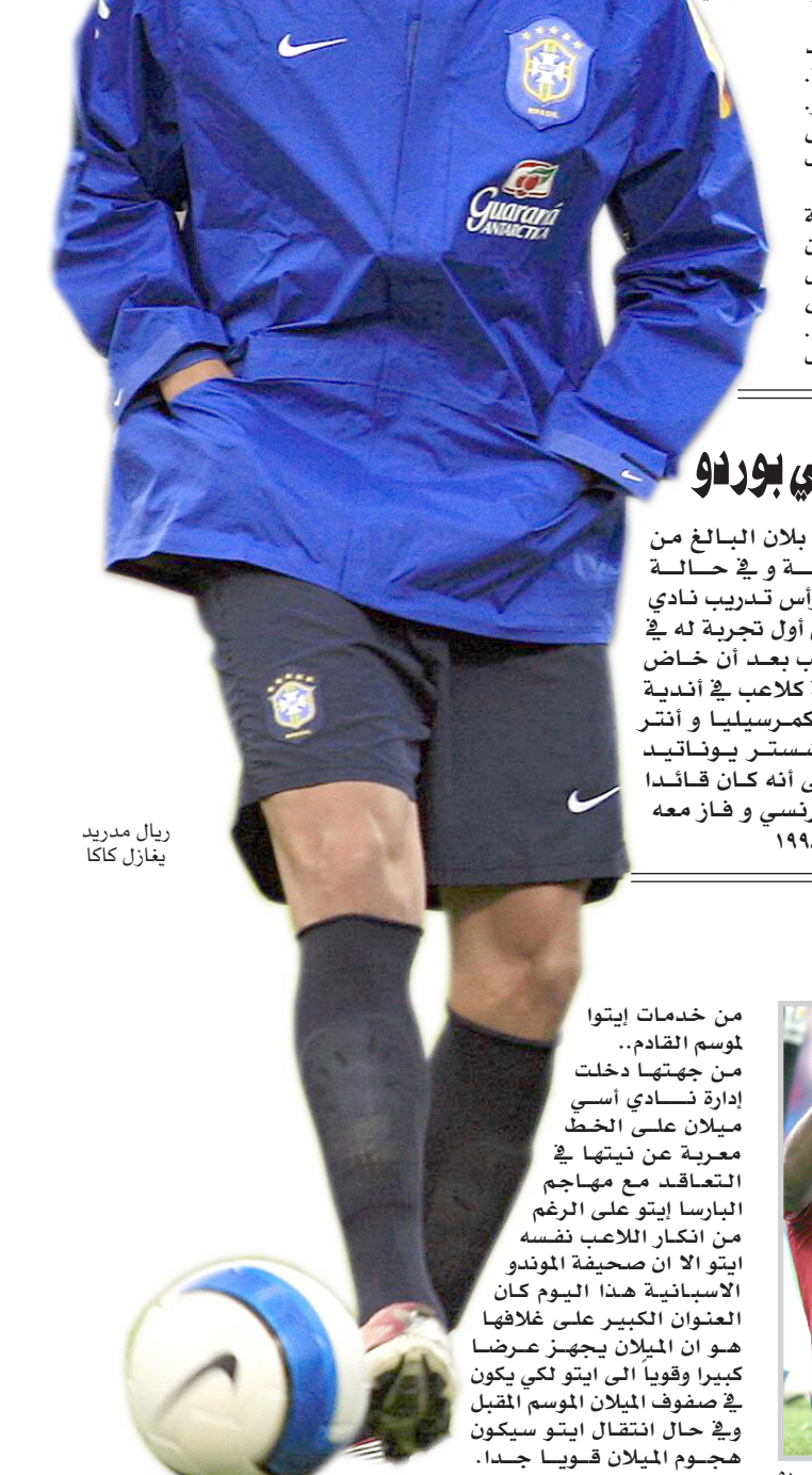
ريال مدريد يغازل كاكنا