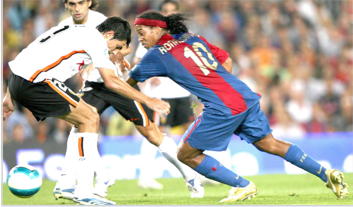
اليوم.. مواجهات ساخنة في الينبا الإسباني

في جدول المسابقة برصيد ٥٨ نقطة لم يخسر على ملعبه في الموسم الحالي سوى ثلاث مرات كما يحتاج للنقاط الثلاث في هذه المباراة لتعزيز موقعه في المركز الخامس وضمان المشاركة في كأس الاتحاد