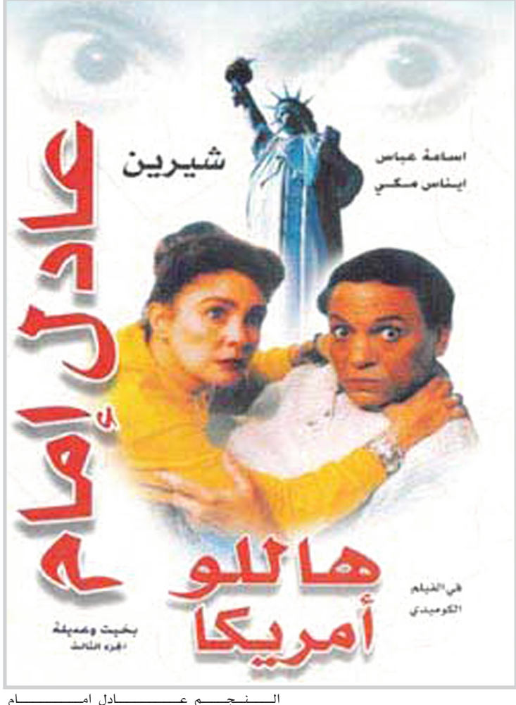
النجم عادل امام

حول افلام عادل امام ذات الطابع السياسي وهي "طيور الظلام"، "التجربة الدائريكية"، "الارهابي"، "الارهاب والكباب"، "عريس من جهة أمنية"، "بخيت وعديلة". فضلا عن مؤتمر صحفي عالمي حول دور عادل امام كسفير للتوايا الحسنة لمنظمة شؤون اللاجئين ومن المقرر ان يلتقي النجم الكبير بعدد من كبار القادة السياسيين والنقاد السينمائيين المغاربة الذين شاركوا في إصدار كتاب "عادل امام ٤٠ سنة سينما" والذي سيصدر خلال فعاليات المهرجان. يصادف الفنان عادل امام في رحلته الترويجية الاولى بالمغرب وفد اعلامي وفني رفيع المستوى ويتضيف المهرجان عددا كبيرا من الفنانين المصريين، فضلا عن مشاركة فيلم "قص ولزق" في المسابقة الرسمية بجانب ١٥ دولة أخرى ويحتفي المهرجان ايضا بتكريم مخرجين راحلين من فرنسا