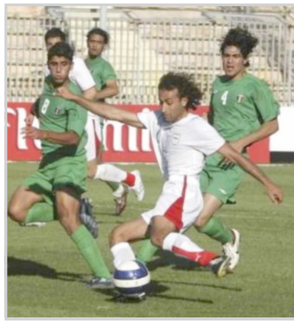
ايران انتزعت نقطة ثمينة من منتخبنا في ملعب القوسية