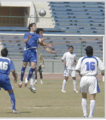
لقطة من مباراة الزوراء والطلبة في دوري النخبة ملاعب اربيل ودهوك لاستضافة المباريات رغم حرص الاتحاد العراقي لكرة القدم ومعه كل المحصلين للاسراع باقمة المباريات وجميع الانشطة على ملعب الشعب الدولي الذي ما زال ينتظر فرقا وجماهيرها التي اعتادت جنياته البطولة نتيجة الظروف الطارئة التي تمر بها العراق احتضان عشرات الاف من انصار الزوراء والشرطة والجوية والطلبة وباقي فرقنا الكروية.

يذكر ان اللجنة المنظمة لدوري ابطال العرب حددت فريق عراقيا واحدا للمشاركة في هذه البطولة بناء على التعليمات اصدرتها مؤخرا.