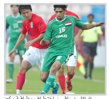
تضال عراقي ياختلف بطلاقة بكن

ومن المؤكد ان هذه الفرق الكبيرة ادركت جيدا حجم المخاطر التي تحيط بمنافسات البطولة والاحتمالات الكثيرة التي يمكن ان تاتثر بسببها. ينتظر فرقا وجماهيرها التي اعتادت جنياته البطولة نتيجة الظروف الطارئة التي تمر بها العراق احتضان عشرات الاف من انصار الزوراء والشرطة والجوية والطلبة وباقي فرقنا الكروية.