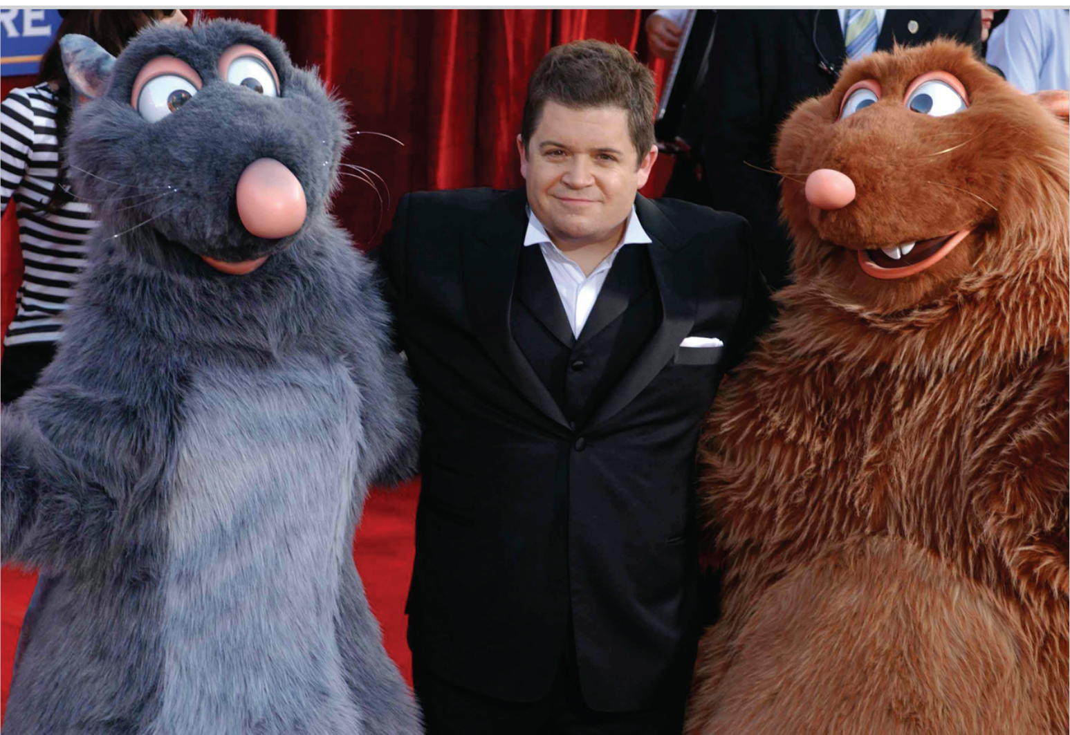
الممثل باتون اولست مع فريق فلمه الجديد (Ratatouille) انتاج ديزني لدى وصوله مسرح كوداك في كاليفورنيا امس لحضور حفل افتتاح الفيلم.

هوكيو / وكالات أعلنت الحكومة اليابانية يوم الجمعة ان أحد أفراد العائلة المالكة اليابانية البارزين وهو ابن عم الامبراطور اكيهيتو سيخضع لعلاج بسبب معاقرة الخمر. وقالت وكالة الشؤون الملكية ان اطباء أفسادوا بأن الامير توموهيتو من ميكاسا (٦١ عاما) - الذي اشتهر بأنه طالب بإعادة تقليد قديم يسمح لأفراد العائلة المالكة بالاحتفاظ بمحظيات- يعاني من أرق شديد. وكان الامير قد أثار جدلا واسعا في عام ٢٠٠٥ حينما روج لفكرة إعادة تقليد المحظيات القديم للحفاظ على نسل الذكور في العائلة المالكة. وتواجه العائلة المالكة في اليابان أزمة عدم ولادة ذكور بها منذ ٤٠ عاما، ما دفع بهيئة مستشاري الحكومة الى التفكير في امكان تولية العرض لامباطورة. لكن محاولات إعادة النظر في قانون خلافة عرش البلاد الذي يسمح للذكور فقط بتولي العرش توقفت بعد أن وضعت زوجة الابن الثاني لأكيهيتو أول مولود ذكر للعائلة المالكة خلال ٤٠ عاما في أيار الماضي.