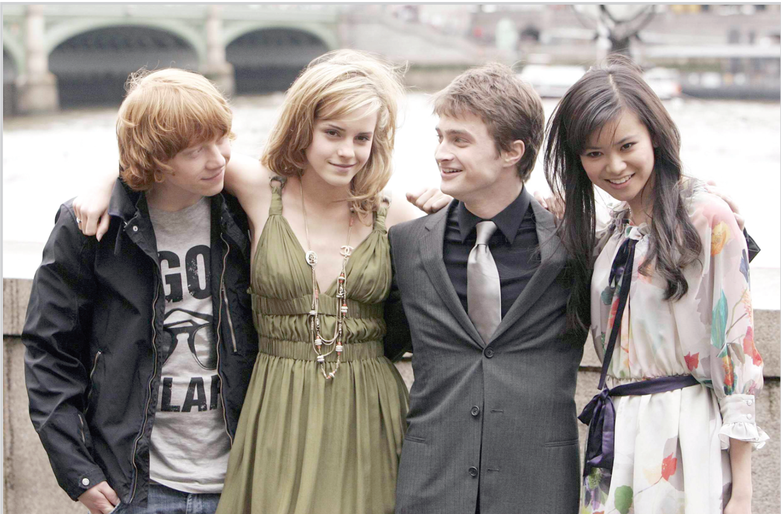
ابطال الفيلم الشهير (هاري بوتر) روبرت كرينغ، ايمواتسون، دانيال رادكليف وكاتي لونغ في وسط لندن لحضور افتتاح الجزء الجديد من الفيلم

ومن المتوقع أن يتم بيع رسالة الأب الروحي للهند النادرة مقابل ١٢ ألف جنيه إسترليني.