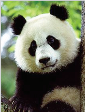
قالت وزارة الخارجية الصينية يوم الخميس إن الصين

وقال كين جانج المتحدث باسم الخارجية الصينية خلال مؤتمر صحفي "انها هدية جميلة للشعب الاسباني ونأمل ان يساعد هذا الزوج من دبية الباندا