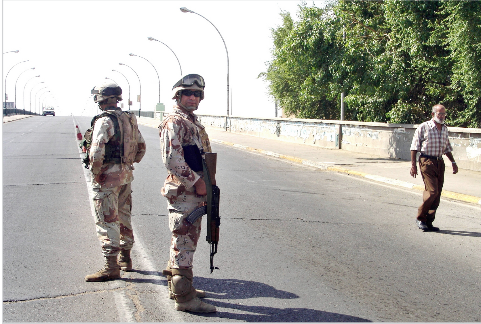
من نهارات حضر التجوال في بغداد.. امس

وأضاف عبد الامير "بلغت نسبة الإنجاز في المشاريع المتأخرة من مشاريع تنمية الاقاليم وتسريع الاعمار لعام ٢٠٠٦ والتي تمت إحالتها مطلع العام الجاري، نحو ٨٠٪". وبحسب مصادر رسمية في محافظة البصرة لتكاً تنفيذ بعض مشاريع تنمية الاقاليم وتسريع الاعمار لعام ٢٠٠٦ بسبب تأخر صرف الميزانية البالغة ٢٥٨ مليار دينار وعدم تقدم الشركات لبعض هذه المشاريع، لكن هذه المشاريع حولت الى ميزانية العام الحالي وتمت إحالتها مطلع العام الحالي. وبلغت ميزانية تنمية الاقاليم وتسريع الاعمار