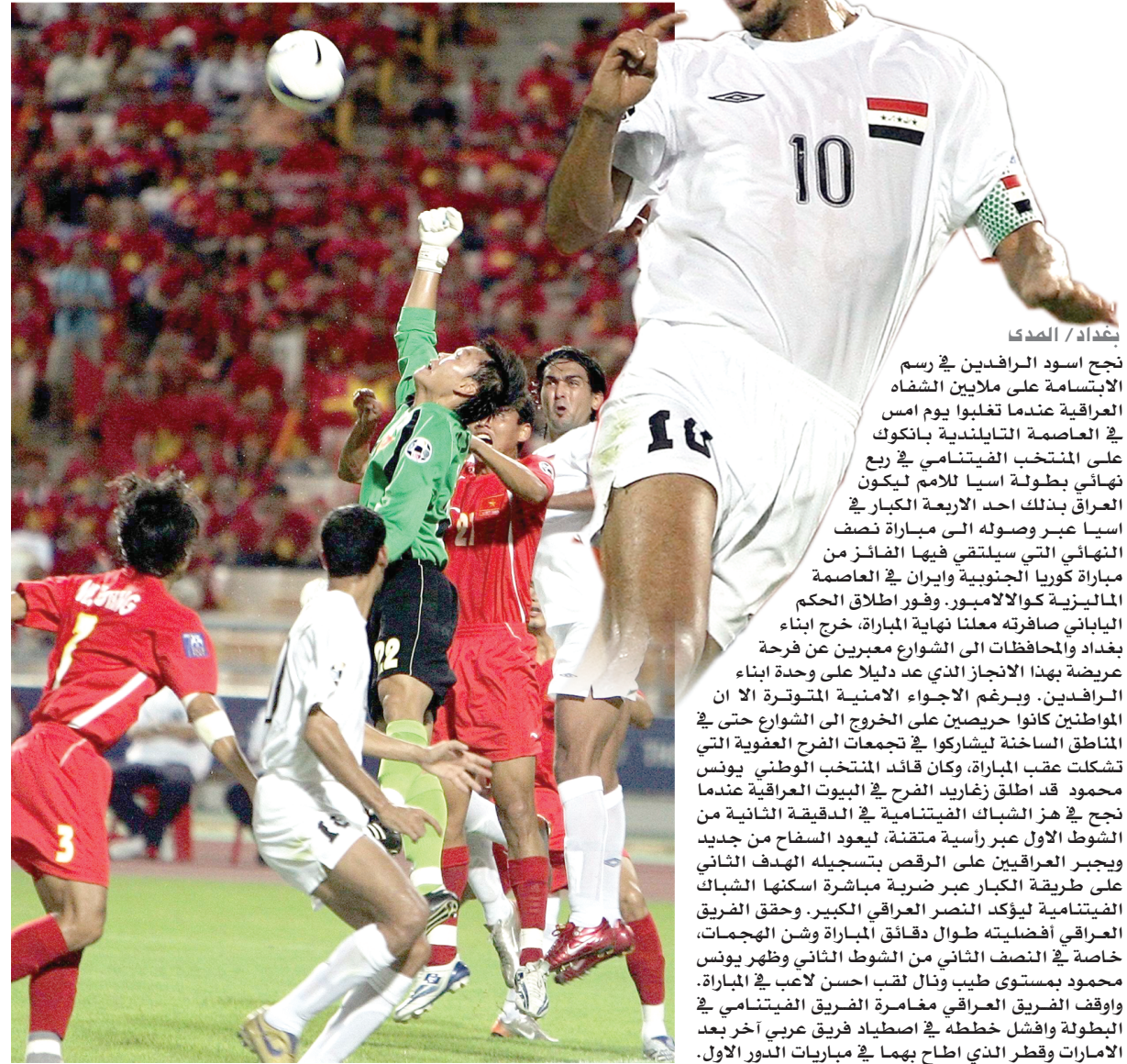
بغداد / الصدا

بعد إقصائه فيتنام... منتخبنا الوطني يستعد لنصف نهائي اسياف كوالالمبور