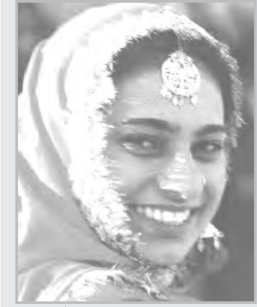
عروس من الايار الهندود