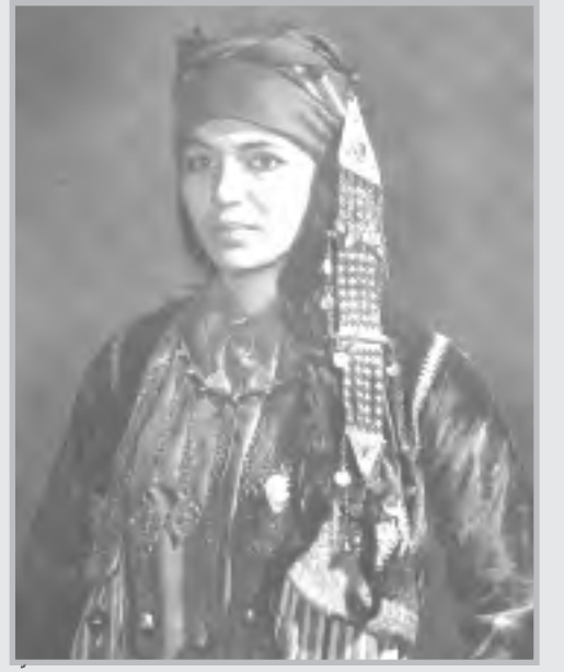
زي من قبيلة شمير