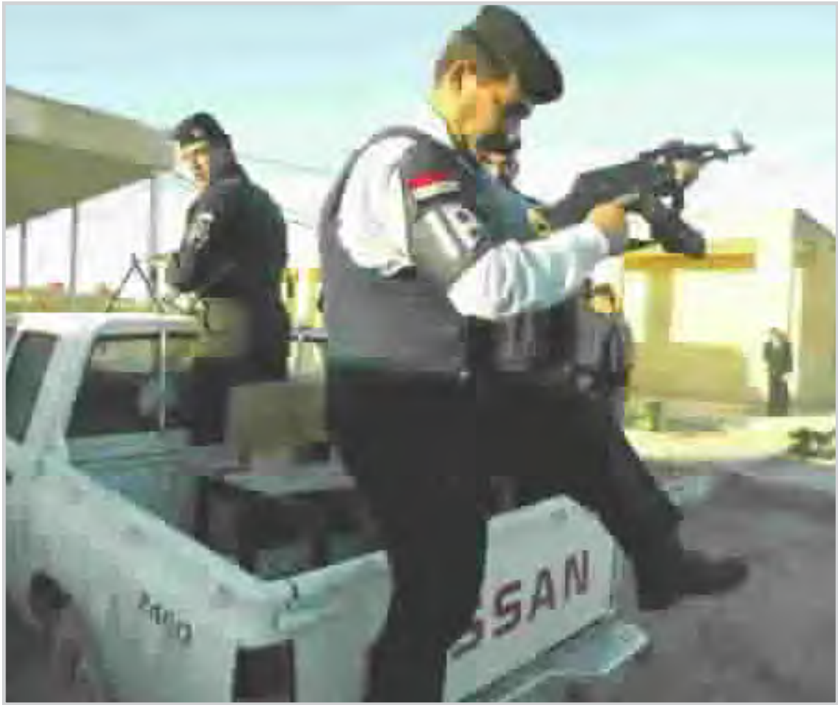
معتقلون في سجن نينوى

طبقات مختلفة من المثقفين والناشطين في منظمات المجتمع المدني، إذ تم الاعتراض على قلة مراكز الاقتراع وعدم كفاية الاستمارات الانتخابية، حتى ان بعض المراكز اعتذرت عن استقبال المواطنين لأن استمارات الاقتراع قد نفذت . وعلى صعيد متصل ذكر شهود عيان شاركوا في الاقتراع ل (المدى) ان الحبر المستخدم في بعض المراكز، ولا سيما في مركز حي الجزائر الانتخابي، كان من نوعية عادية يمكن ازالته بسهولة، كما لم يتم اجبار المقترعين على مهر اصابعهم بالحبر.