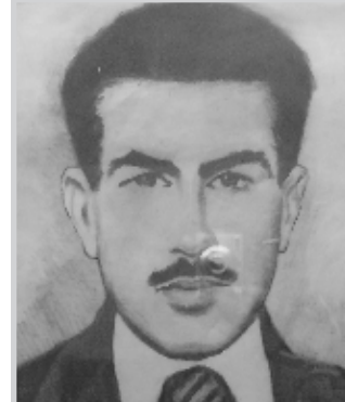
الشهيد الخالد فهد

الشعب ويمثل شهداء الحزب قاسما مشتركا لكل مكونات الشعب العراقي اذ مثل في برامجه السياسية كل مكونات الطيف العراقي ولهذا كان من بين اعضائه العربي والكوردي والصابئي والاشوري والايديزي ان ارادة تمثل الجميع لم تكن سياسة خاصة بكسب الجماهير بقدر ما كانت تعبر عن الجوهر الانساني لفكر هذا الفصيل الوطني.