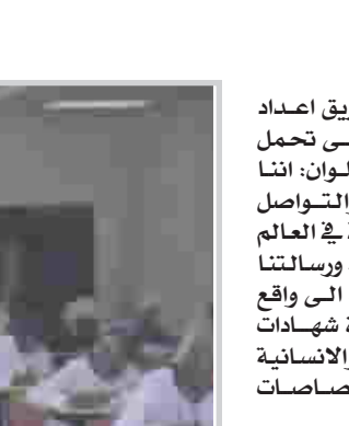
مكتبة الجامعة ورفدها بالاصدارات

واضاف ان الجامعة تسعى في ضوء التطور الحاصل في التعليم العالي الى زيادة كلياتها ومراكزها البحثية وانفتاحها على الجامعات العالمية التي ترتبط بها بعلاقات ثقافية وعلمية واكاديمية بهدف توسيع التعاون ويجاد فرص تطويرية وزمالات الخبرات العلمية والقاء البحوث العلمية المشتركة بين اساتذة جامعة البصرة والجامعات التي ترتبط معها بعلاقات ثقافية. هذه كلها مؤشرات على تطوير الجامعة وتعزيز افاقها العلمية المستقبلية وضمن الاستعدادات لعام ٢٠٠٧ تم استحداث