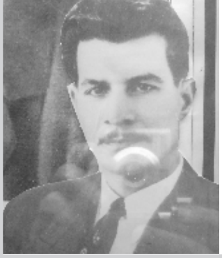
الشهيد سلام عادل

تاريخ مشرف قال لؤي: "ان الشيوعيين العراقيين يعترفون بالتاريخ المشرف لحزبهم الذي تأسس عام ١٩٤٣ وكان من الاحزاب الوطنية التي دافعت عن مطالب الجماهير الكادحة من العمال والفلاحين، وخلال نضاله الطويل تصدى للانظمة الاستبدادية التي كانت تحكم البلد بدءا من النظام الملكي وانتهاء بالنظام الشمولي الذي اسسه وقام به حزب العفالة في عامي ٦٣-٦٨،