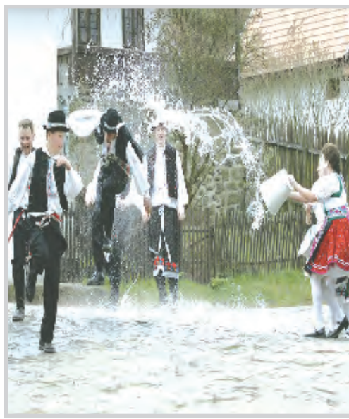
* وسط العاصمة بودايست فتيات بالزي المحلي الهنغاري يلعبن بالماء.

* صورة فوتوغرافية اطلقتها الشرطة اليونانية لتمثال مسروق عثر عليه في احدى الشقق.