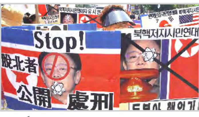
أداة الرئيس الأمريكية

وتابع ان الفلسطينيين يرون ان هذا الانسحاب "جزء من عملية انهاء الاحتلال ويجب ان يكون على حساب الضفة الغربية". وشدد رئيس السلطة الفلسطينية على ضرورة "التحرك الفوري نحو مفاوضات الوضع النهائي لمعالجة قضايا القدس الشرقية عاصمة دولة فلسطين المستقلة، واللاجئين والاستيطان والحدود والامن والمياه على قاعدة رؤية الرئيس بوش وقرارات الامم المتحدة ومبادرة السلام العربية".