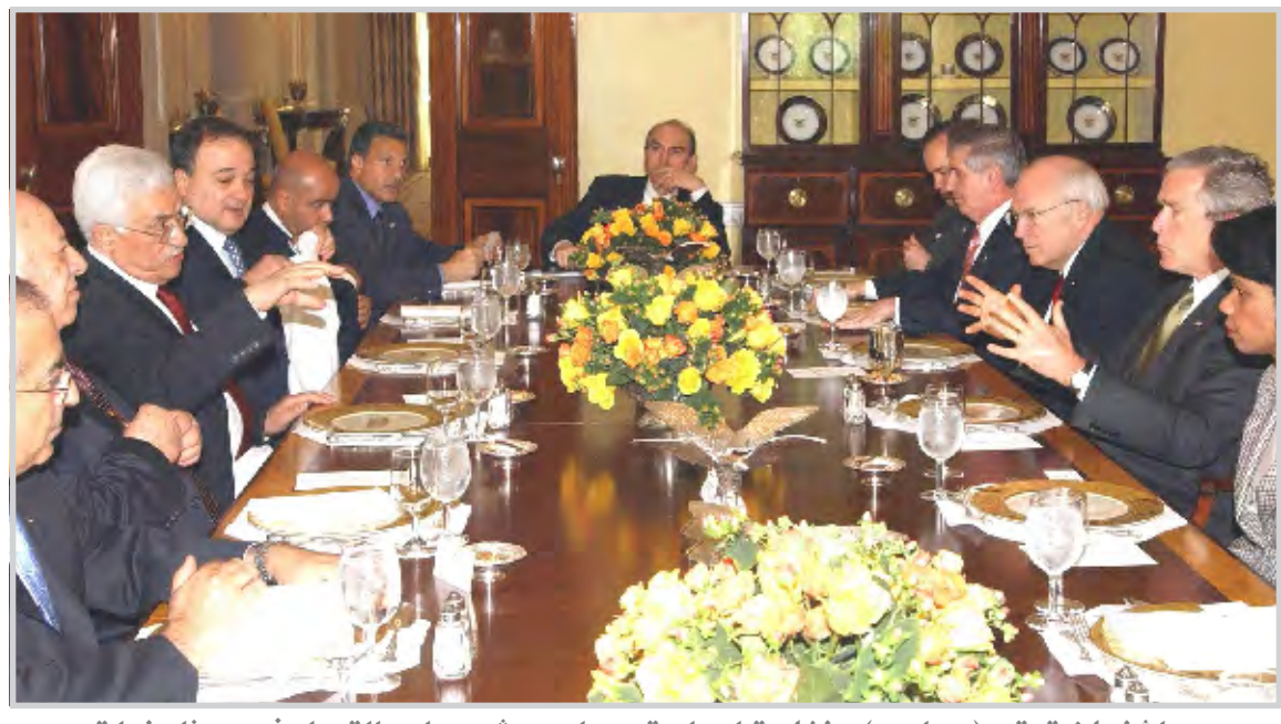
واشنطن تعتبر (حماس) منظمة إرهابية وعباس يشدد على التحرك نحو مفاوضات الوضع النهائي لمعالجة قضايا اللاجئين والقدس الشرقية والاستيطان

فلسطينية مستقلة ومتصلة جغرافياً وقابلة للاستمرار وغير مجزأة". وأشار عباس إلى "حرص الإدارة الأمريكية على التأكد من أن الانسحاب من غزة لن يحول القطاع إلى سجن كبير". وقد رحب مسؤولون فلسطينيون بنتائج القمة، مشيرين خصوصاً إلى تأكيد بوش الدعم الأمريكي لإنشاء دولة فلسطينية وتقديم أكبر مساعدة فورية من الولايات المتحدة لحكومتهم.