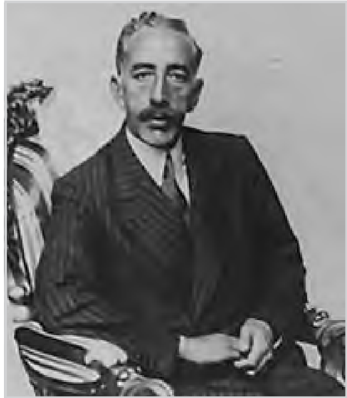
الملك فيصل الاول