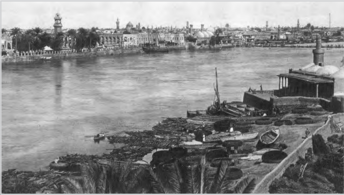
منظر مدينة بغداد في بدايات القرن الماضي