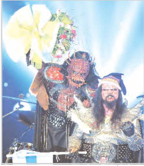
* اغنية سوبر ستار يقودها الفريق التركي في مهرجانات الاغنية.