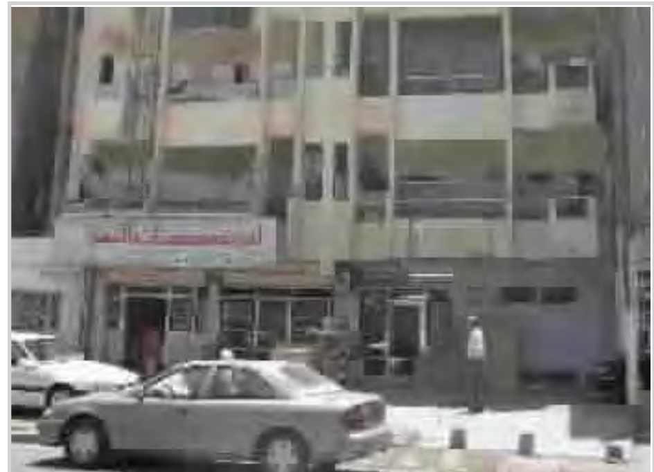
بيت عبد الكريم قاسم

في هذه المساحة التي تشغلها هذه العمارة التي تظهر في الصورة، كان يقع البيت الذي يسكنه الزعيم عبد الكريم قاسم، وبعد الفوضى التي حدثت في ٨ من شباط في عام ١٩٦٢، تم إزالة هذا