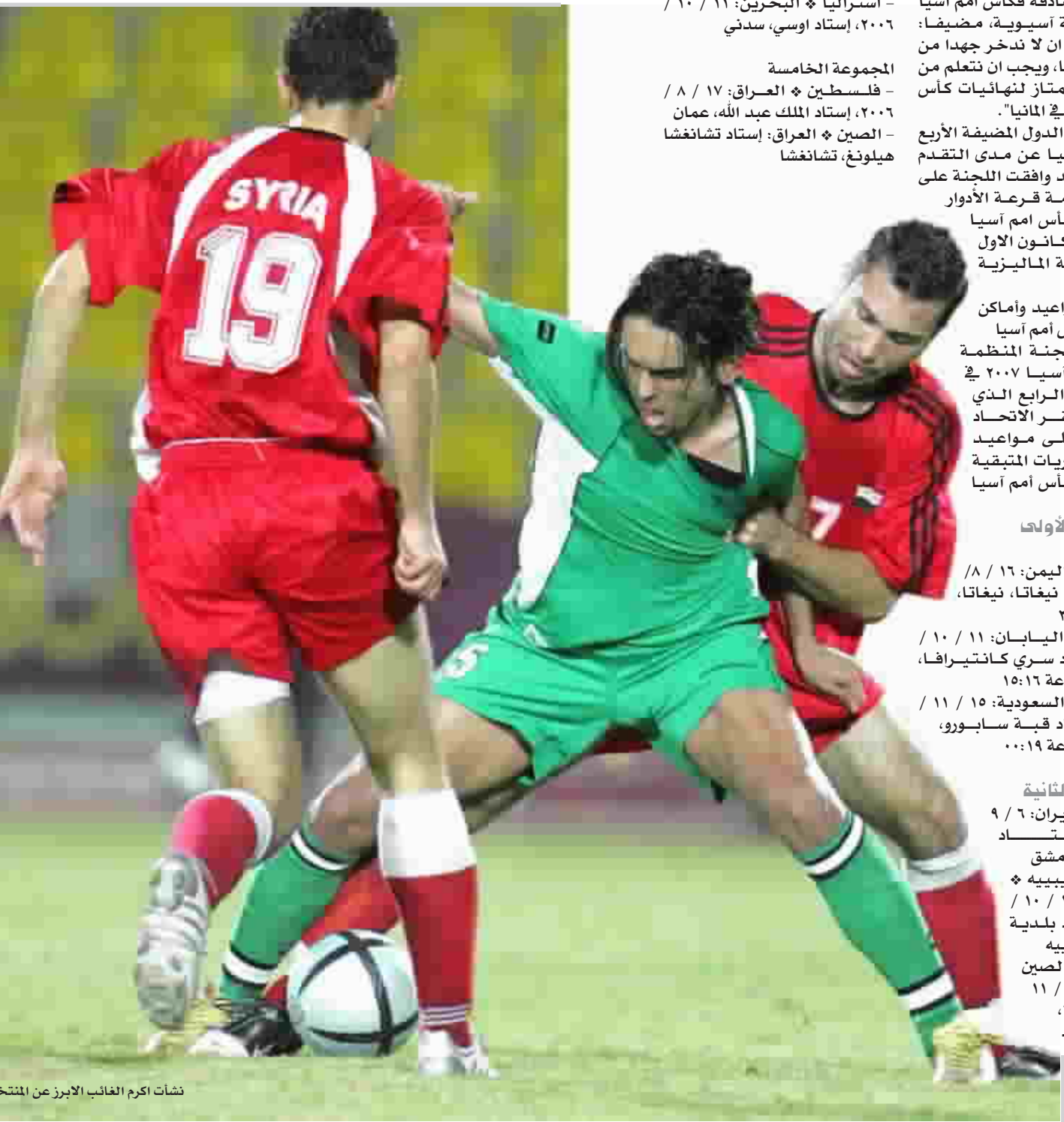
نشأت اكرم الغائب الابرز عن المنتخب

وقال لفئة " اسفرت منافسات البطولة عن بروز العديد من العناصر الشابة الواعدة في عالم اللعبة".