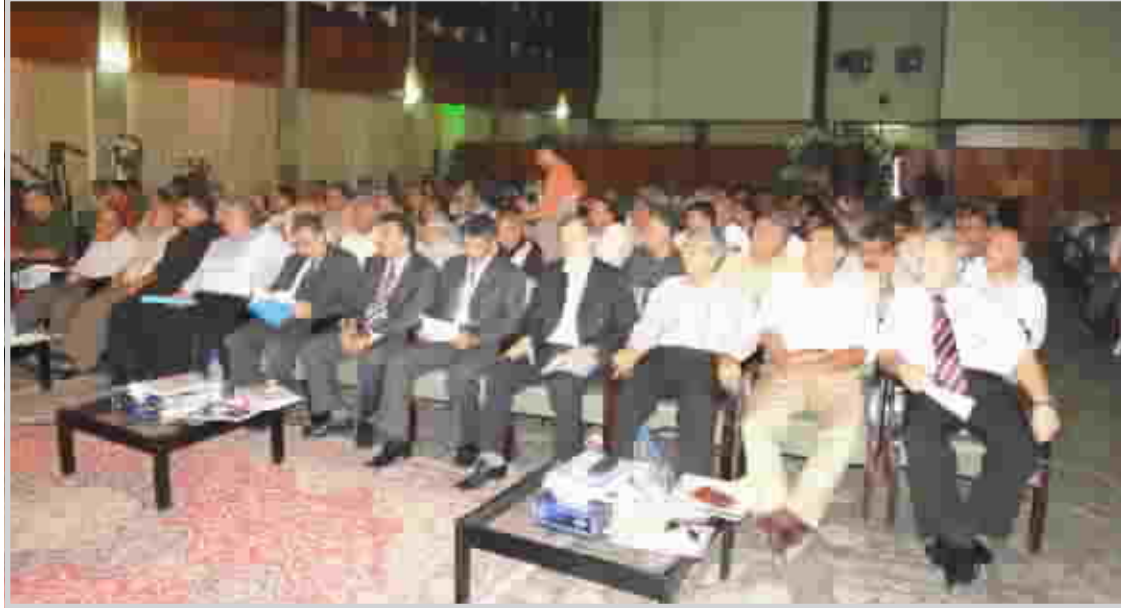
جانب من اعضاء الجمعية العمومية للجنة الاولمبية