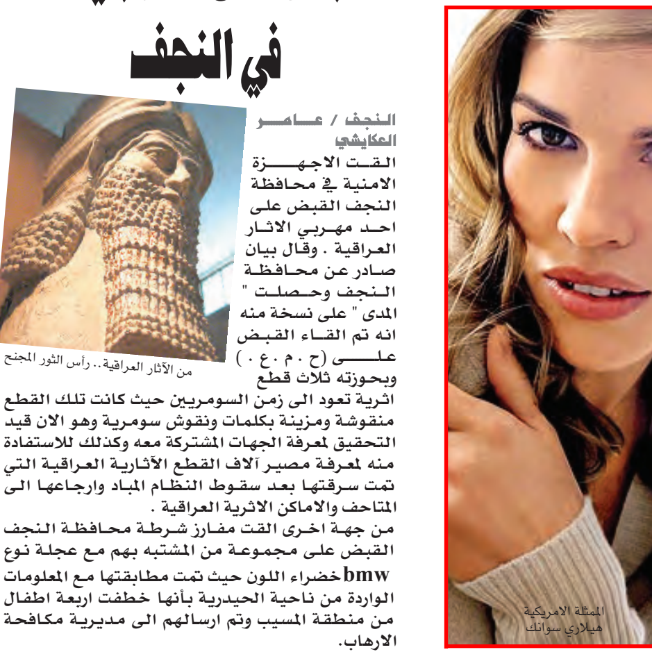
هيلاري سوانك الممثلة الأمريكية

هوليوود: أعلنت الممثلة الأميركية هيلاري سوانك أن سبب اتخاذها قرار الانفصال عن زوجها الممثل تشاد لوي، هو وصوله إلى حالة من الإدمان، مما أدى إلى انهيار زواجهما بعد ثمان سنوات. وقد أكدت سوانك أنها صدمت صدمة كبيرة عندما علمت بأن زوجها تشاد لوي مدمن، لأنها لم تكن تتخيل أبداً أنه يخفي شيئاً عنها. وتجدد الإشارة إلى أن الزوجين مسازلا صديقين وسيحتفظان بعلاقة طيبة بعد الطلاق، ويشار إلى انهما قد اتفقا على الطلاق منذ يناير الماضي. كما حصلت النجمة سوانك على جائزتين اوسكار اولاهما في عام ٢٠٠٠ عن دورها في فيلم "الأولاد لا يكونون"، ثم فازت باوسكار ٢٠٠٥ عن دورها في فيلم "حبيبة بلمليون دولار".