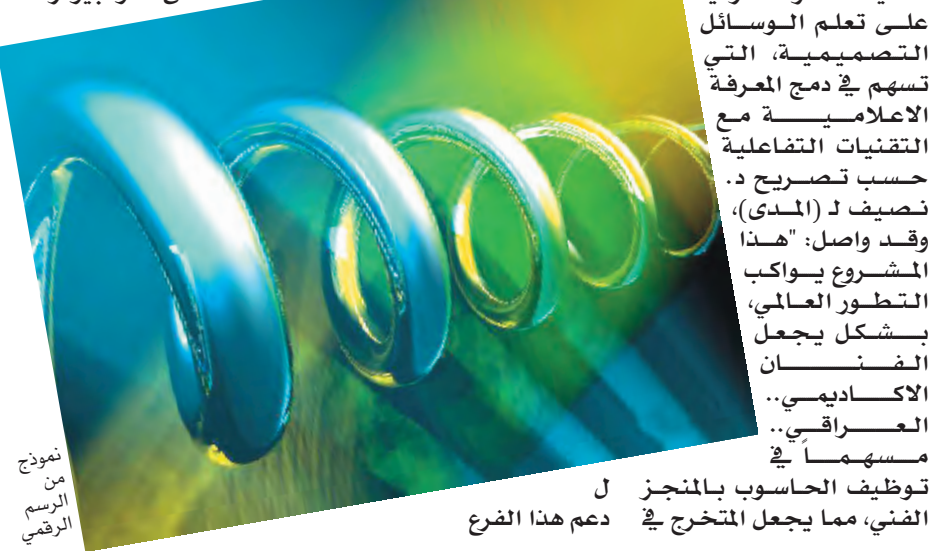
توظيف الحاسوب بالمنجز الفني، مما يجعل المتخرج في دعم هذا الفرع

يقدم د. نصيف جاسم محمد مقرر قسم التصميم في كلية الفنون الجميلة / جامعة بغداد، بمقترح الى وزارة التعليم العالي والبحث العلمي، تم الاخذ به، واقراره من قبل الوزارة، تاركاً للكليه آلية تنفيذه. تقوم الفكرة على اقتراح قسم لبرامجيات الحاسوب التي تعنى بالتصميم الرقمي (الكرافيكي) بحيث يتخرج الطالب في الكلية، قادراً معرفياً على تعلم الوسائل التصميمية، التي تسهم في دمج المعرفة الاعلامية مع التقنيات التفاعلية حسب تصريح د. نصيف ل (المدى)، وقد واصل: "هذا المشروع يواكب التطور العالمي بشكل يجعل الفنان الأكاديمي.. العراقي.. مسهماً في