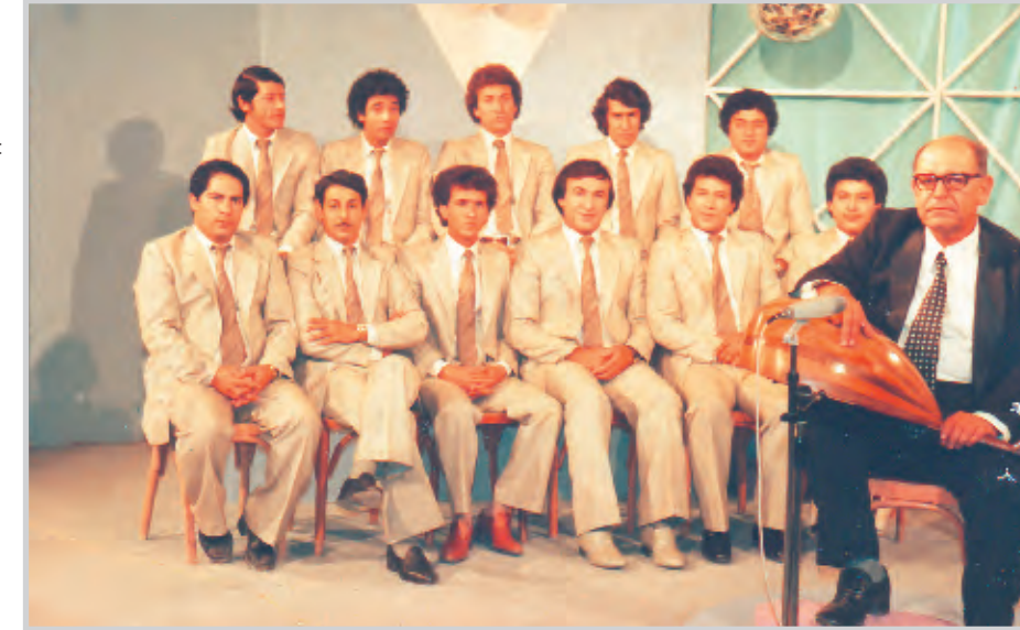
فرقة الإنشاد العراقي عند تأسيسها.. من الاربعة.

بغداد / سقار البغدادي وتطعيمها باصوات شابة جديدة.. * ودوركم في هذه الفرقة؟ - سيكون دوري هو الإشراف ومدّها بالخبرة المختزنة بتاريخ الفرقة وانشطتها داخل العراق وخارجه وتحفيظهم ما حفظته سابقاً من الأغاني والأدوار والموشحات.. * ولكن سجل الفرقة من هذه الأغاني يشير الى أرقام عالية نسبياً؟ - نعم.. فرقتنا قدمت أكثر من (٣٠٠) موشح (٤٠٠) اما الأغاني البغدادية فتزيد على الرقم (٤٠٠) لغنا الأناشيد الوطنية فبحدود (١٥٠) نشيداً.