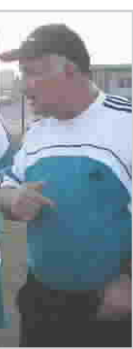
المدرّب اكرم سلمان

بدأ شبح الازمة التدريبية يلقي بظلاله على طبيعة المنتخب العراقي لكرة القدم المقبل على انعطاف حادة في مسيرته عندما اعلن المدير الفني للمنتخب اكرم احمد سلمان واحد اعضاء الجهاز الفني المدرب رجب حميد