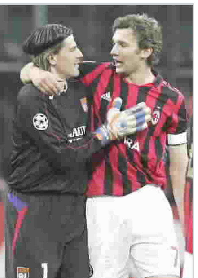
شيفشينكو اغلى لاعب في كرة القدم البريطانية

ميلان / الوكالات أكد المهاجم الأوكراني ولاعب نادي تشيلسي أندريه شيفشينكو أن مالك نادي تشيلسي الملياردير رومان ابراهيموفيتش وزوجته كانا احد أسباب مغادرته للميلان والتحاقه بصوف نادي تشيلسي. وكان شيفشينكو قد انتقل لتشيلسي مقابل ٢٩ مليون جنيه ليصبح أعلى لاعب في تاريخ كرة القدم البريطانية. وذكر شيفشينكو الشهير ب (شيفا) أن ابراهيموفيتش كان يلاحقه من ثلاث سنوات ، وقال شيفشينكو : "اعتقد انه كان الوقت الصحيح ، لمدة ثلاث سنوات كان تشيلسي يطاردني وتكلمت مباشرة مع زوجتي حول ذلك ، لسدي طفل واخسر في الطريق واتخذنا هذا القرار معاً، كان ابراهيموفيتش دائماً سعيداً بالقدوم للميلان والحديث معي، وقد قدرت اهتمامه الكبير بي