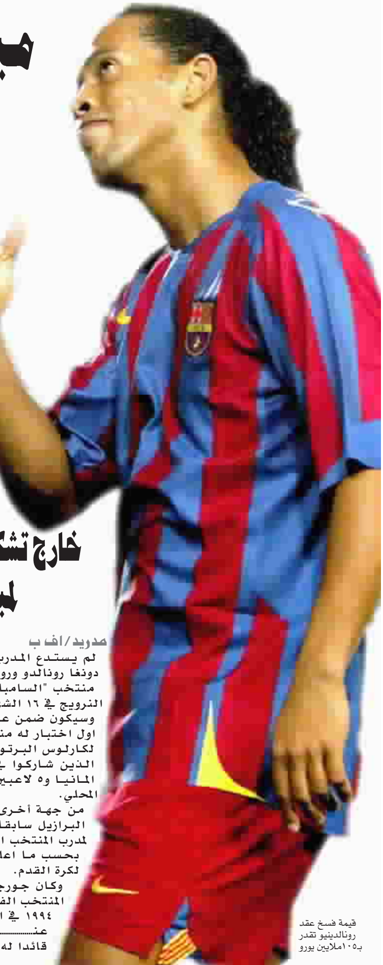
قيمة فسخ عقد رونالدينو تقدر بـ ١٠٥ ملايين يورو

ورفض ريال مدريد التعليق على ما ذكره "تيلي مدريد" الذي أكد إن كاكّا يسعى جاهداً لإقناع إدارتي ميلان بتسهيل انتقاله مقابل صفقة "معيّنة" تجنب تعقيد المفاوضات بين