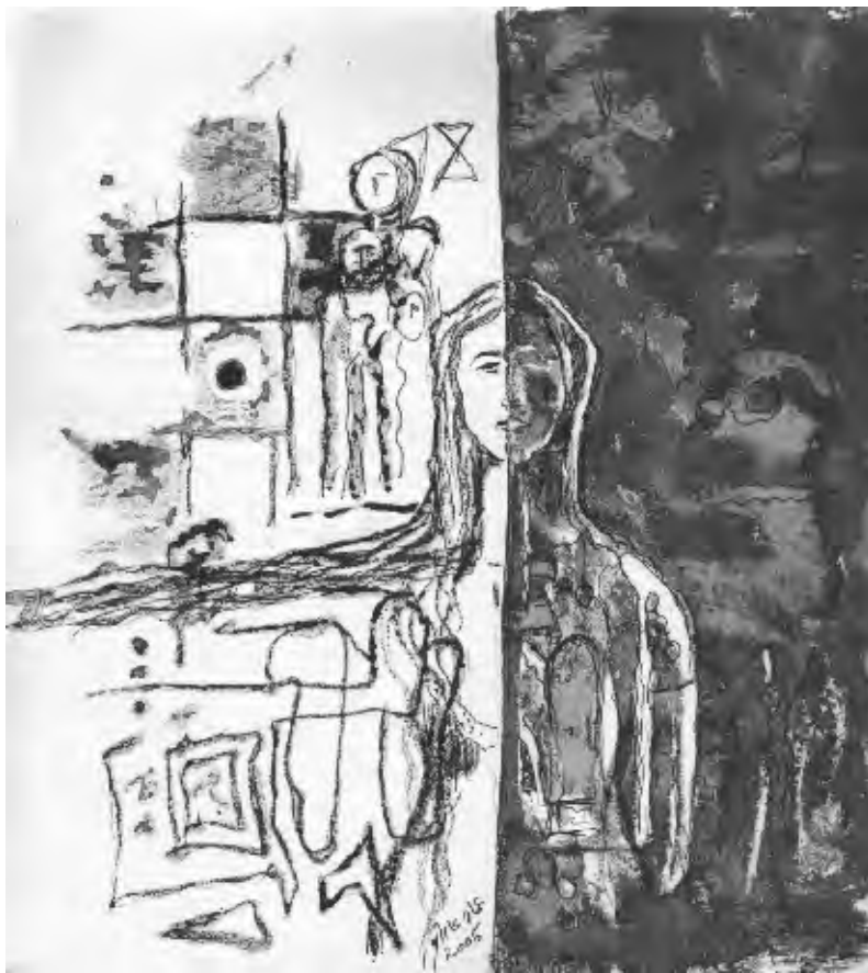
ويبقى لي جسد مسمر في الأرض فما نفعه!

الريح تتسرب أوصد الباب أقذف مفتاحه إلى البحر والريح لا تزال إلي تتسرب من شق في السقف ومن ثقب في جدار أحاول خانية أسد الشقوق والثقوب أجمع ما تفتت من الروح أغلق منافذها لكنها لا تزال بقوة تتسرب