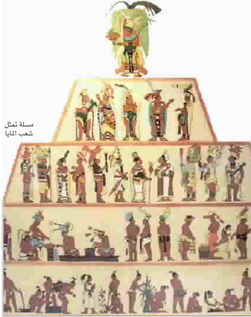
مسلة تمثل شعب المايا

لقد تشكلت سينوتات، او تجاويف المنطقة البالغ عددها ٧٠٠٠ الى ٨٠٠٠ عندما انهارت على انفسها واصبحت الحضر او الثقبو الناجمة عن ذلك مصدرا مائيا حيويا وبؤرة لقرابين المايا من اجل تكريم شاك اله المطر الشبيه بالمساح. وفي السنوات الاخيرة، فان البايولوجيين الذين يفتشون داخل الانظمة النهرية التحتية، التي تبدو سوداء اللون بسبب النقص في ضوء الشمس، قد حددوا ٤٠ نوعا جديدا كلية من الكائنات الحية، معظمها من السمك والروبيان الاعمى الذي تكيف مع الحياة في بيئة قاسية حيث يندر وجود الاوكسجين النحل والغذاء. ومن بين الاكتشافات المذهلة كائنات حية مجهرية تعيش في المنطقة الانتقالية حيث الماء المالح الذي يمكن ان يحتوي على مركبات مضادة للأورام. وقال ايليف لوكال رويترز: ان البحث ما زال في مرحلة مبكرة، ولكن من الممكن تماما ان تكون للبكتريا والاسفنج استعمالا طبية بايولوجية، بما في ذلك علاجات للسرطان، وهناك قدر كبير من الاثارة العلمية بشأن ذلك.