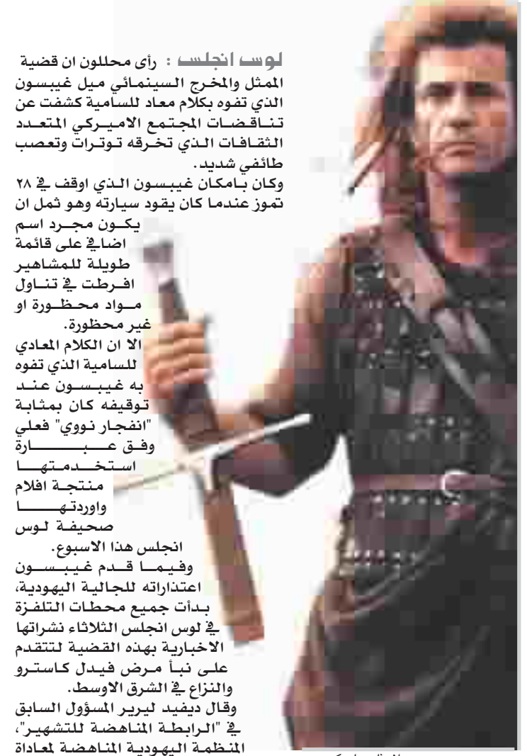
الممثل ميل كيبسون