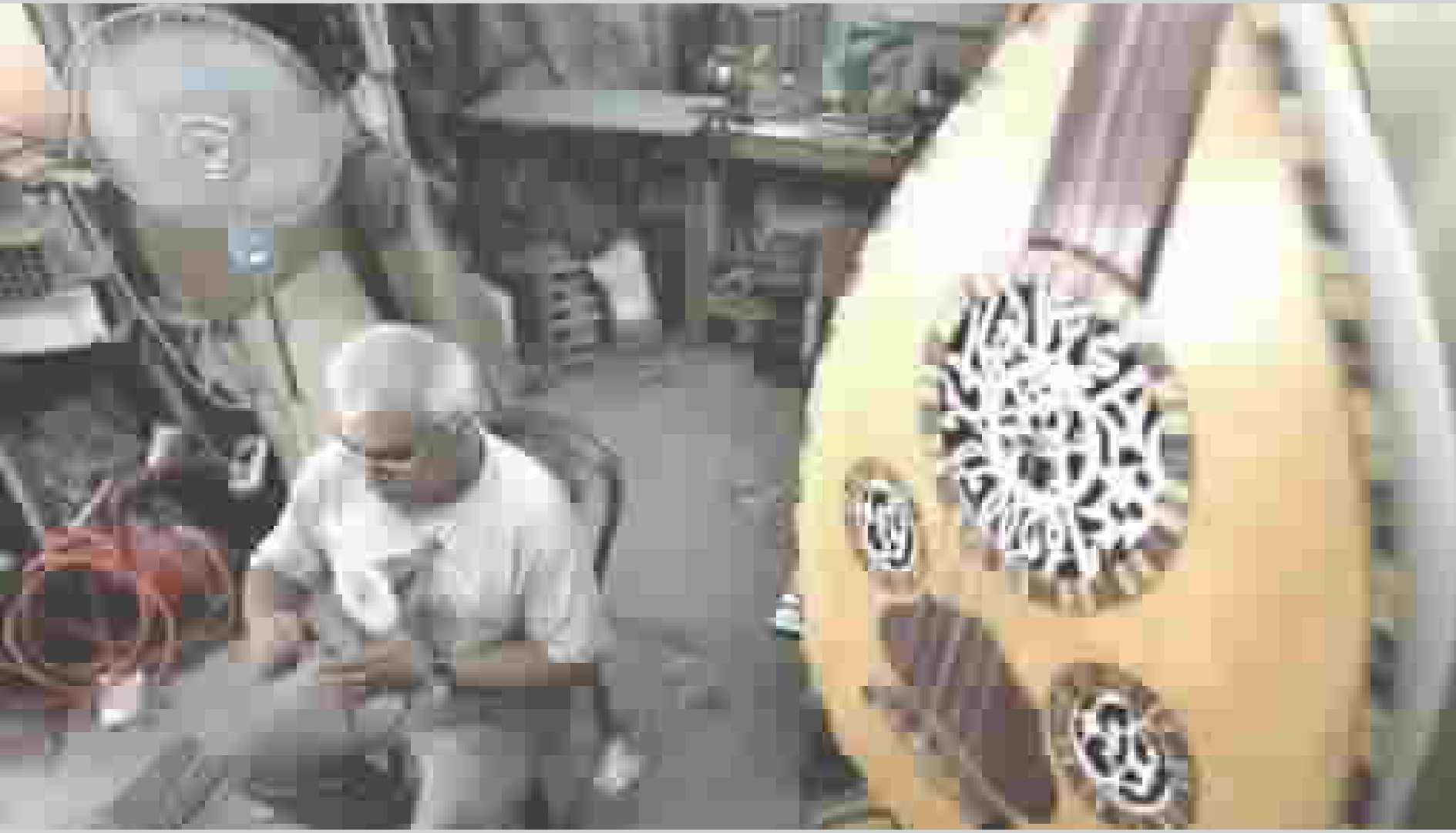
رغم الازهاق .. صناعة العود تلقى رواجاً لها في بغداد