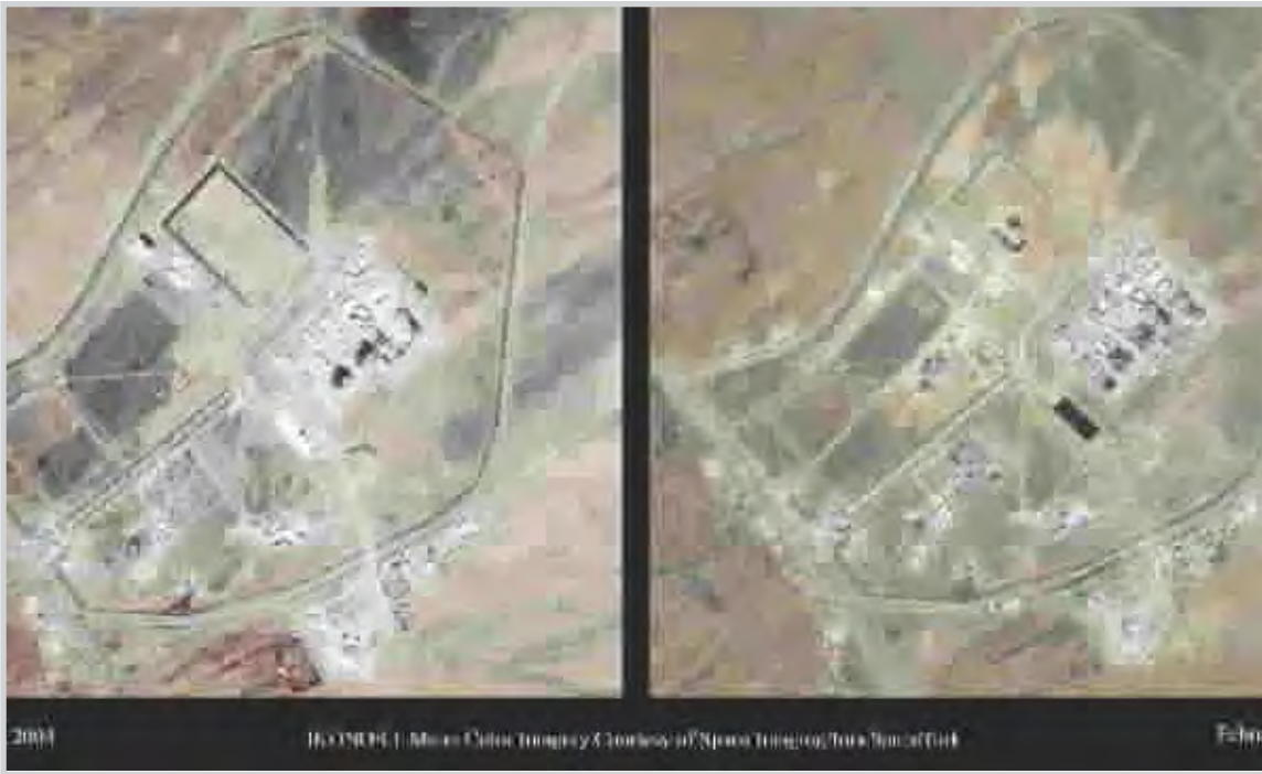
صورة جوية للمفاعل النووي الإيراني

صاروخها (نودونغ) في مايو (أيار) ١٩٩٣ ، حضر خبراء عسكريون إيرانيون التجربة، وقامت طهران بعدها، وتحديداً في العام ١٩٩٨ بتطوير الصاروخ الإيراني (شهاب ٣) الذي تم اختباره بنجاح، ووصفه هاشمي رفسنجاني (الرئيس الإيراني الأسبق) بأنه صناعة إيرانية.