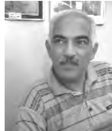
الشاعر رعد عبد القادر

قصائده، مستعرضاً فيها العراقيين المكبلين بقيود الديكتاتورية البغيضة، وكان يمررها الى الطابع عن الننتاج تامة، ومن دون خوف من النتائج الوخيمة التي ستجره الى معتقل ما او حبل مشنقة ينتظره ليكلف حول رقبته... الا ان العناية الالهية كانت تحف به دوماً، وتقيه مما سيؤول اليه رأسه، بعد ان كان يصدر مجاميعه التي ينتقد فيها الواقع المر في ظل حكم صدام البغيض.