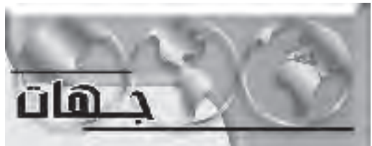
المدا / وكالات