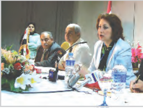
سندات اراضيا الصحيفيين الاخيرة وهمية

بتوزيع الاراضي السكنية على المواطنين في الوقت الحاضر. اكدت وزيرة البلديات: ان كل هذه المنظمات والجمعيات وهمية وغير شرعية ولا يحق لها توزيع الاراضي وان الوزارة مسؤولة عما تقوم به وسوف يتحمل المواطنون الذين يتعاملون معها كل المسؤولية وستقوم الوزارة بازالة كل التجاوزات التي قام بها المواطنون من بناء المساكن والمؤسسات والجموع والحسينيات واما في ما يخص الصحفيين الذين تسلموا من هذه الجمعيات سندات وهمية ان الوزارة لم تخصص اية قطعة ارض الى اي مواطن في العراق حتى الآن بل سيتم التوزيع وفق الشروط والضوابط والعدالة على المواطنين من دون استثناء. وبينت الهندسة بروري: ان شحة المياه الصالحة في محافظة بغداد ليست من شأن وزارة البلديات وانما المسؤولية تقع على امانة بغداد العنيد في هذا واطرافها من مسؤولية الوزارة كونها مرتبطة بالمؤسسات البلدية في بغداد والمحافظات كافة.