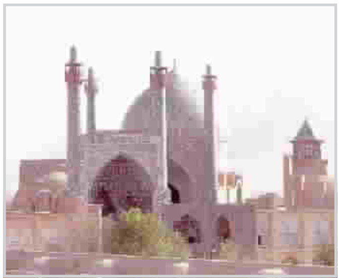
( مسجد امام ) في اصفهان منظر من الامام