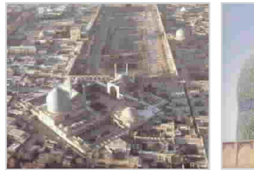
المسجد منظر من الجو

شغل مركز المدينة الجديدة ميدان فسيح تتوسطه ساحة مترامية الاطراف هي : "ميدان شاه " ، التي قدرت مساحتها بما يقرب من ثمانية هكتارات ونصف الهكتار . احتلت قيصور وحدائق الشاه الجهة الغربية من الميدان الكبير ؛ واتصلت تلك الحدائق مع جادة " جهاز -باغ " - وهو طريق يمتد من الشمال الى الجنوب بصورة مستقيمة لمسافة تصل الى حوالي اربعة كيلومترات قاطعة نهر " زياندا رود " من خلال جسر بقناطر ، ومنتهيه بساتين الشاه الواقعة في اطراف المدينة . وعلى الرغم من سعة وجرأة المخططات الحدائقية تلك التي تم تنفيذها في هذا الجانب من المدينة ، والتي فاقت في ريادتها