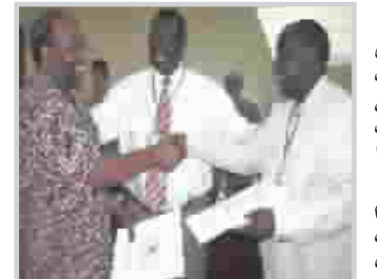
اتفاقية الهدنة بين الجانبين

بين الحكومة وجيش الرب للمقاومة. وقال "عندما ستقرب المهلة سنناقش الامر مع حكومة جنوب السودان التي تقوم بالوساطة في المفاوضات".