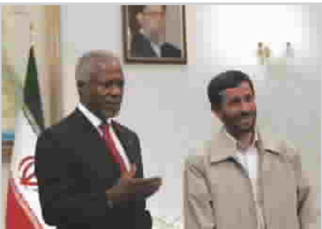
انان والرئيس الايراني