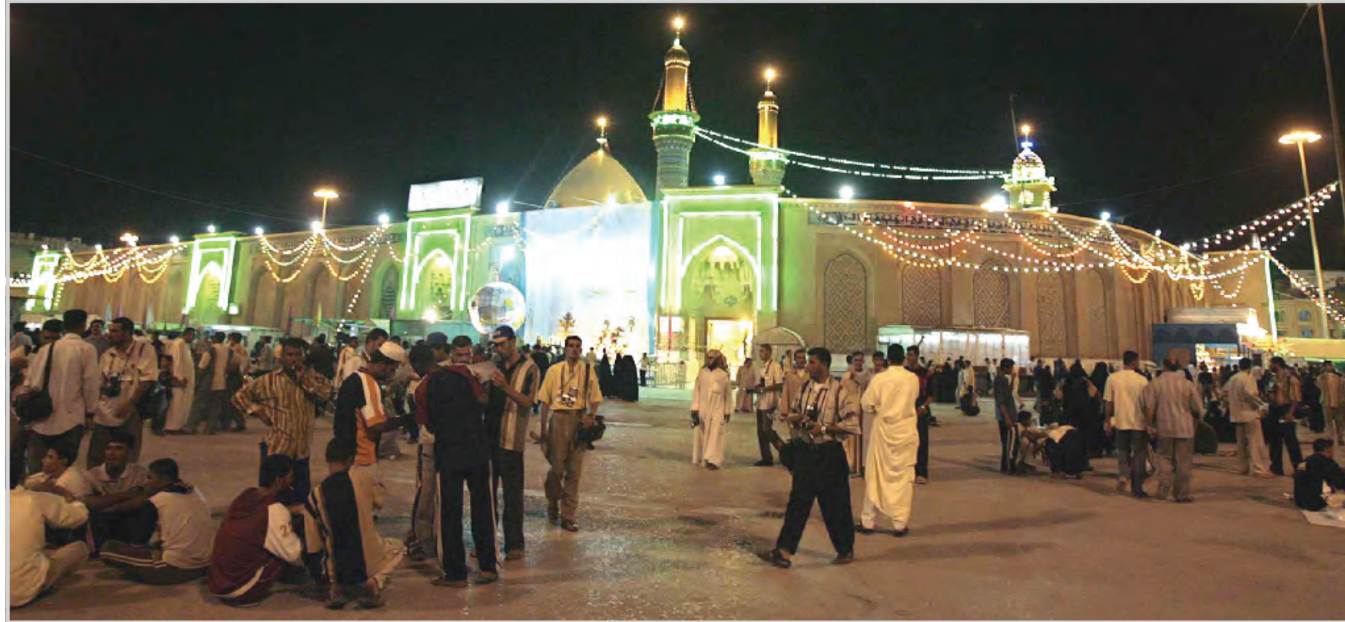
بغداد / الصدا

قررت وزارة المالية تقديم قروض الاسكان للمواطنين كافة بقيمة تتراوح بين ٢٠ إلى ٣٠ مليون دينار عراقي لمن لديه قطعة أرض جديدة ومبلغ ٨ إلى ١٢ مليون دينار للراغبين في بناء ملحق أو طابق جديد وحسب الضوابط.