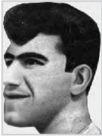
واسط / جبار بجايا.

الصامته وكذلك الناطقة على شارع (الكورنيش) ثم سينما الجمهورية الصيفية عام ١٩٥٨ قرب الأسواق المركزية الآن دار مهجورة بعدها سينما الشعب الشتوية مكانها في ساحة العامل أزيحت وبنيت على أنقاضها محال تجارية بنيت عام ١٩٦٠ ثم سينما الشعب الصيفية عام ١٩٦٣ قرب سدة الكوت ثم تركزت لمدة عشر سنوات وأعيدت لها الحياة بفضل أولاد الرحوم سيد سلوم وكانت صالة السينما مقسمة إلى عدة مواقع وكل موقع له سعره، عرض المقدمات وابتداء الفلم يكون (الوج) والموقع الثاني (٧٠) فلما (الوج) الثالث (٤٠) فلما يسمى (أبو ٤٠) وهو سعر البطاقة ثم بعد عرض المقدمات وابتداء الفلم يكون دخول كل شخصين ببطاقة وكذلك أماكن مخصصة للعوائل (٢٥٠) فلما ومن أشهر الأفلام التي عرضت في دور السينما هي أفلام عنتر وعيلة، طرزان فلاش، فلاشك كوردن، زورق، وأفلام روين هود، الطائر وسوير مان والخفاش وبساط الريح وعلاء الدين والصباح السحري وأفلام علي بابا وعمر الخيام، شارلي شابلن وأفلام إسماعيل ياسين، فريد الأطرش، عبد الحلیم حافظ، محمد عبد الوهاب، محرم فؤاد، أم كلثوم، نعيمة عاكف، ليلى مراد، سعاد مكاي، وأسماهان، كذلك أفلام رعاة البقر المسمى (الكاويوي) ومن أشهر الأفلام العربية السوق السوداء، ودعاء الكروان، أحنه التلامذة بين الأطلال، رصاصه في القلب، شفيقة