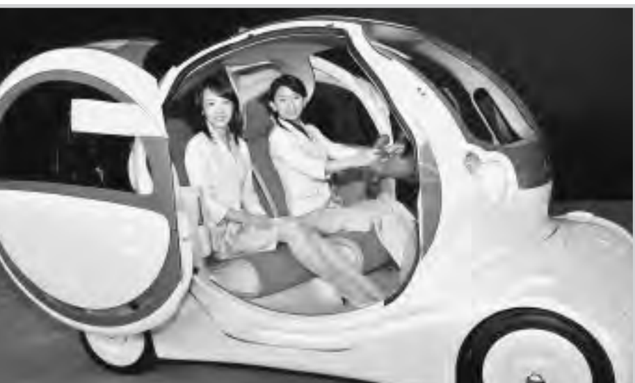
طوكيو - ميدلا إيست اونلاين

وبشكل سيارة بيضو التي يبلغ طولها ٢.٧ مترين بيضوي ويقوم هيكلها على أربع عجلات صغيرة. ويمكن للسائق قيادتها باتجاه او باخر حسب وضع المقصورة. وغطاء السيارة الامامي والخلفي مجهز بوسادات تسمح بالجلوس عليها عندما تكون متوقفة. وبيضو مجهزة ايضا بابع كاميرات فيديو تصور خارج السيارة لالغاء نقاط عدم الرؤية وينظام للاشعة تحت الحمراء يسمح بتوجيه نظام الملاحة وكذلك الراديو ومشغل اسطوانات الموسيقى. وستعرض هذه السيارة التي لن تطرح مبدئياً في الاسواق في معرض طوكيو للسيارات الذي يفتح ابوابه في ٢٢ تشرين الاول وحتى السادس من تشرين الثاني