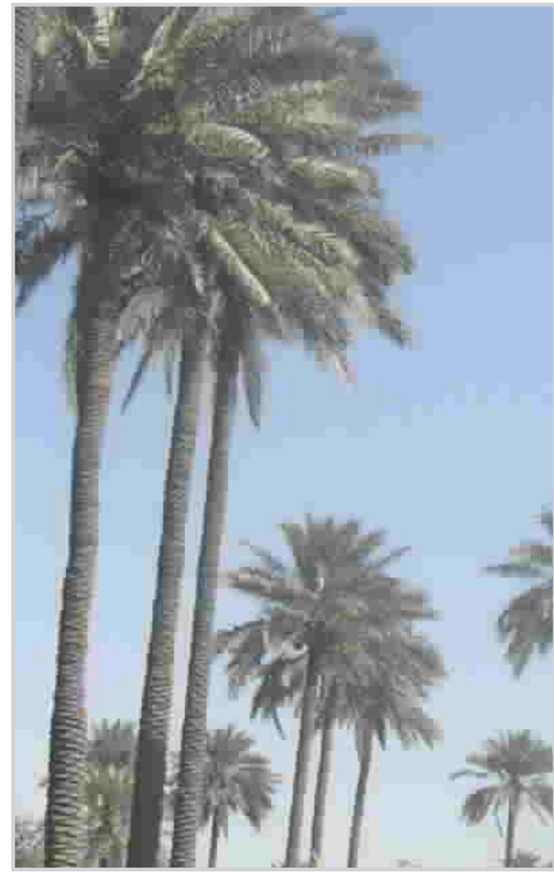
اكرموا عنتمك النخلة