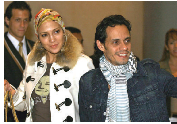
المغني الأميركي مارك أنطوني مع زوجته الممثلة الأميركية الشهيرة جينيفر لوبيز خلال وصولهما الى ليمّا لتقديم عدد من الحفلات.