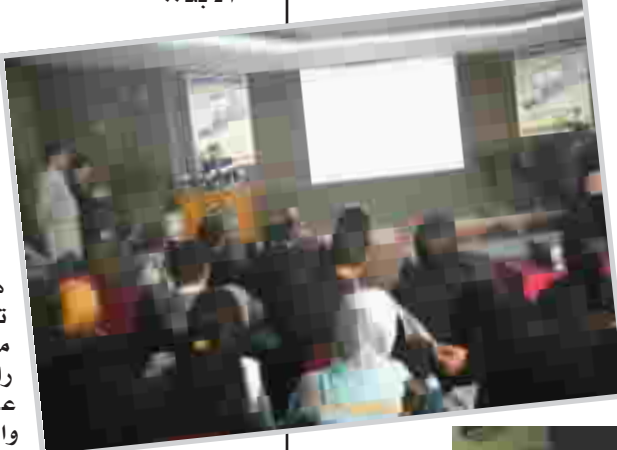
على بدء العد التنازلي لموعد الانتخابات المقبلة.

الإرهاب والانقطاعات الكهربائية وجهان لعملة واحدة) هكذا اختصر المرشح الانتخابي مشكلة الكهرباء والإرهاب!! الحقيقة هي أن (الكهرباء) التي ما زالت على ترديتها وانقطاعاتها هذه الأيام، بل وأخذت تزداد سوءاً مع اقتراب موعد الانتخابات، رافقتها في الوقت ذاته، عمليات الاغتيالات والتصفيات الجسدية ليكون ذلك مؤشراً آخر على بدء العد التنازلي لموعد الانتخابات المقبلة. أزمة الكهرباء والإرهاب هما وجهان لعملة واحدة، دون شك، لكن في حالة فوز المرشح الذي أعطى الوعد وحصد الأصوات هل سيحقق لنا ذلك؟ أم إنها ستكون، كما كل الوعود على الملصقات الكثيرة، وفي جميع أنحاء العراق، مجرد حملات انتخابية ووعود من أجل كسب الأصوات ليس إلا؟