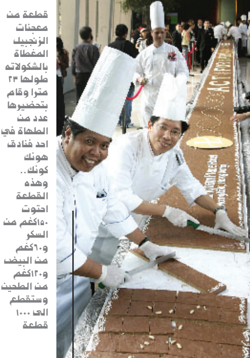
قائمة من وصفات الزنجبيل المغلطة بالشوكولاته طولها 23 مترا وقام بتحضيرها عدد من الطهاة في احد فنادق هونك كونغ.. وهذه القلعة احتوت 100 كغم من السكر و10 كغم من البيض و12 كغم من الطحين وستقلعها 1000 قطعة