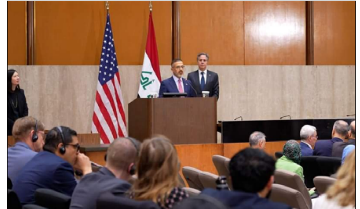
وفد العراق والولايات المتحدة يجلسون في اجتماع مشترك في واشنطن، بحضور مسؤولي الجانبين.

ورحبت الولايات المتحدة بفرصة إعادة تأكيد مواصلة دعم العراق في تعزيز ستراتييجيته