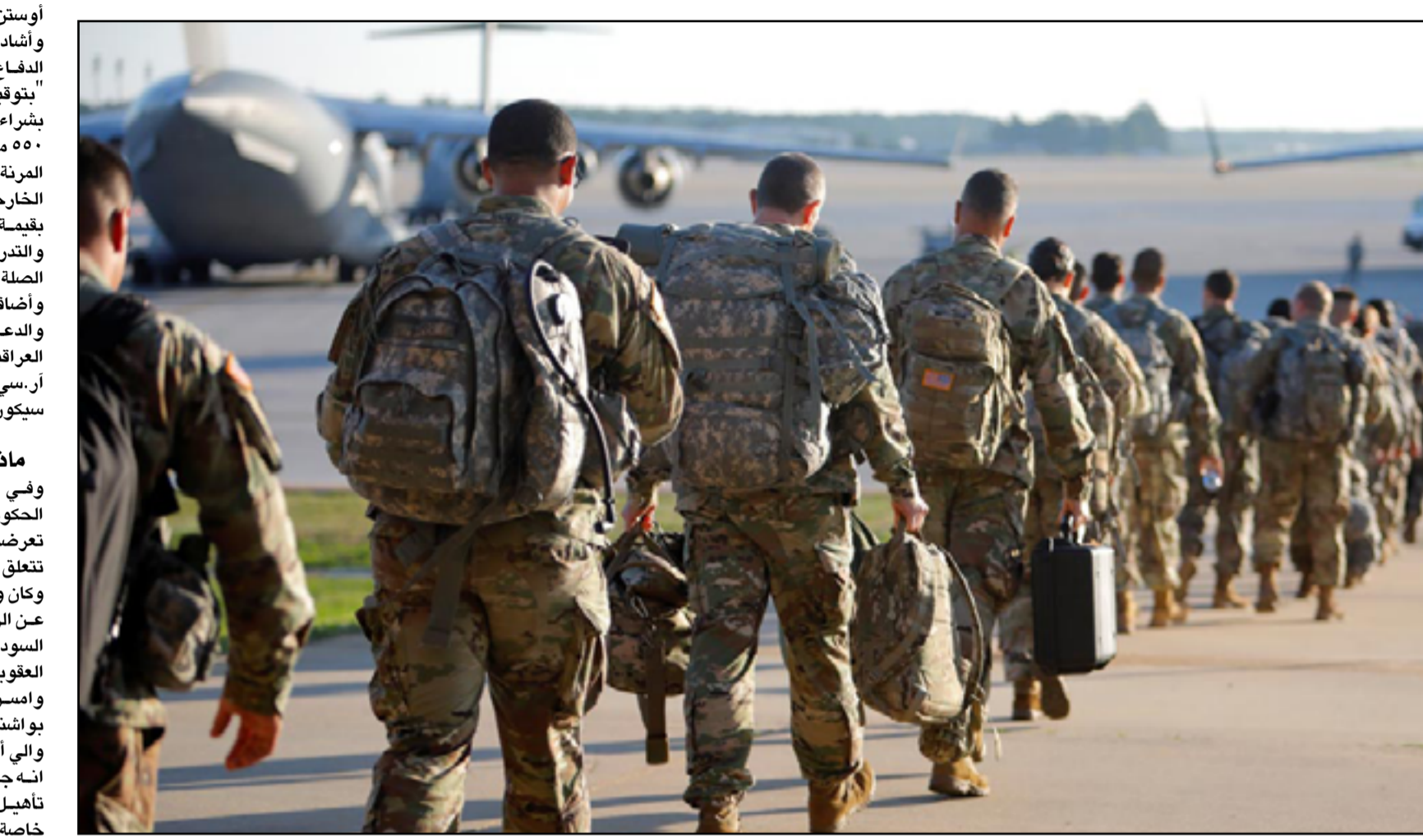
جنود أمريكيين يمشون على مدرج المطار في واشنطن، وهم يحملون معداتهم وهم يرحلون من العراق.

التهديد المستمر من داعش، والمتطلبات التشغيلية والبيئية، وتعزيز قدرات قوات الأمن العراقية". وأكد الزعيمان على أنها "سراجان هذه العوامل لتحديد موعد نهاية مهمة التحالف الدولي في العراق وكيفيتها والانتقال بطريقة منظمة إلى شراكات أمنية ثنائية دائمة، وفقاً للدستور العراقي واتفاقية الإطار الاستراتيجي بين الولايات المتحدة والعراق". وأكد الزعيمان أيضاً على عزمهما عقد حوار التعاون الأمني المشترك بين الولايات المتحدة والعراق في وقت لاحق من هذا العام لإجراء محادثات حول مستقبل الشراكة الأمنية الثنائية. وفي غضون ذلك لم تعلق المجموعة المسلحة التي تطلق على نفسها اسم "المقاومة العراقية" على الزيارة حتى